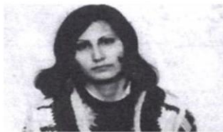
اشرف دهقانی رهبر چریک‌های فدایی خلق بود که معتقد بودند مبارزه مسلحانه را باید ادامه داد

پیش از انقلاب اسلامی، افرادی در بندرعباس به چریک‌های فدایی خلق پیوستند و گروهی را تشکیل دادند. پس از پیروزی انقلاب و در سال ۵۸ اعضای اصلی این گروه برای حضور در مراسم سخنرانی اشرف دهقانی به مهاباد رفتند. پس از آن این افراد به توسعه گروه خود پرداختند، به طوری که چریک‌های فدایی خلق به دو هسته سپاهکل و هرمزگان تقسیم شد.