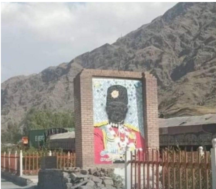
د امان الله خان مخ تورول، په ښکاره ډول د «خادم دین رسول الله» د جهادي او طالبی شاګردانو ډار برملا کوي. په ټولنیزو شبکو کې وینو، چې څنگه جنایتکاره شوری نظاریان د جنایتکارو طالبانو له دې ګرځېدنې عمل څخه دفاع کوي.

کړه د ښځو د پوهې، اقتصادي خپلواکي او د کورنۍ د معیشت د بهتروالي لپاره مهم ګڼل. هغه په یو شاهي اعلامیه کې، چې د دې په لاسلیک صادر شوی وه، په څرګند ډول لیکلې وو چې: له دې ښوونځیو څخه موخه له خاوندانو څخه د ښځو د اقتصادي وابستګۍ خلاصون او د کورنۍ له اقتصاد سره مرسته ده. ملکه ثریا په دې پوهېده چې اقتصادي خپلواکي، د نورو آزادیو بنسټ او اساس دی. نو د همدې لپاره یې پر دې مسئلې ډېر ټینګار کاوه. خو له بده مرغه روحانیونو او د سیمې له مرتجع ځواکونو سره تړلې ملایانو آرام نه درلود او د دې پیلامې پر ضد یې حرکتونه او اعتراضونه پیل کړل. امان الله خان دا ارتجاعی اعتراضونه وځپل او هغه ۵۳ مرتجعو کسانو ته، چې په اعدام محکوم شوي وو په خطاب کې وویل: ما مکاتب جوړ کړل، تاسې فکر کوئ چې دا مکاتب ما د ځان لپاره جوړ کړي؟ ما هغه یوازې ستاسو د اولادونو لپاره خلاص کړل. تاسې وویل چې د انجونو تازه تاسیس ښوونځي وټرم، مخ ۷