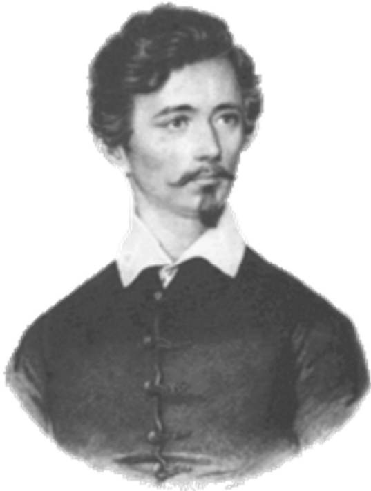
شاندور پتوفی مجارستانی انقلابی شاعر