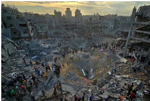
تصویری از غزه

تحولات غزه و سوریه نیاز به راه‌حلی را آشکار می‌کند که نمی‌توان آن را به تعویق انداخت. بیایید با هم به فراخوان صلح، دموکراسی و خواهری-برادری پاسخ دهیم. ما در آستانه یک فرصت تحول دموکراتیک برای ترکیه و منطقه هستیم. اکنون زمان شجاعت و آینده‌نگری برای صلح شرافتمندانه است.»