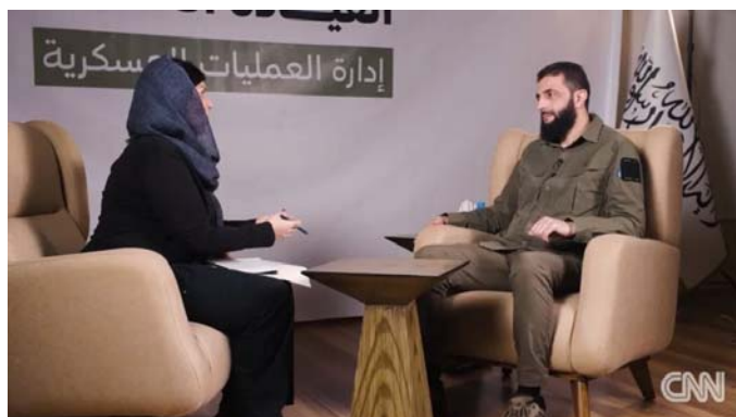
ابهام‌ها و دانسته‌ها درباره حجاب اجباری در سوریه

است، همچنین افسر «ج» رئیس واحد راه‌اندازی که باید الگوی هشدار را آماده می‌کرد، این مسئولیت را برعهده نگرفت و به دنبال آن است که فرمانده آتی یگان ۸۲۰۰ شود. در مقابل سخن‌گوی ارتش اسرائیل گفت: در هفتم اکتبر یگان ۸۲۰۰ بخشی از شکست اطلاعاتی رخ داده در آن روزها بود و نتایج تحقیقات درباره اتفاقات رخ داده در هفتم اکتبر پس از آن‌که در قالب کار تحقیقاتی منظم و حرفه‌ای حاصل شود، به‌صورت شفاف و علنی ارائه خواهند شد.