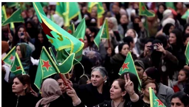
تظاهرات زنان قامشلی با پرچم سبز یگان‌های مدافع زنان (ی‌پژ) وابسته به یگان‌های مدافع خلق (ی‌پ‌گ)

ترکیه به‌طور مداوم حملات هوایی و عملیات نظامی برون‌مرزی علیه مردم خلق کرد روژآوا و همچنین نیروها و مقرهای حزب کارگران کردستان، که پایگاه‌هایی در مناطق کوهستانی شمال عراق، انجام می‌دهد.