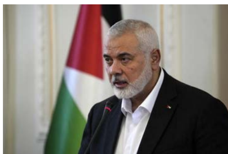
اسماعیل هنیه رهبر حماس