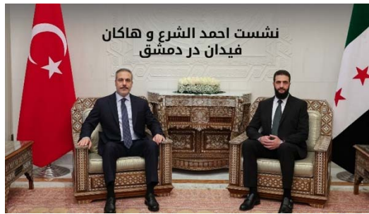
احمد الشرع، رئیس گروه تحریر الشام و هاكان فيدان، وزیر امور خارجه ترکیه