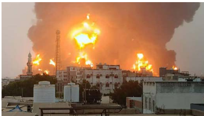
حمله اسرائیل به اهداف نظامی حوثی‌ها در نزدیکی بندر حدیده در یمن

تحلیل‌گران کانال ۱۲ گفته‌اند که این عملیات بسیار پیچیده‌تر از آن بوده که تنها توسط ماموران اسرائیلی انجام شود و احتمالاً شهروندان ایرانی، اعضای سپاه پاسداران یا حتی مقاماتی از حماس در آن نقش داشته‌اند.