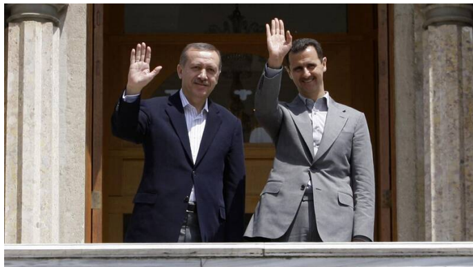
بشار اسد رئیس‌جمهور سوریه و رجب طیب اردوغان رئیس‌جمهور ترکیه

تحریم‌های اقتصادی اروپا و آمریکا، ناتوان از کمک اقتصادی یا سرمایه‌گذاری در این کشور بودند.