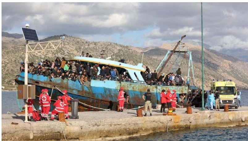
کشتی پناهندگان در یکی از سواحل یونان

«ما می‌دانیم که مهاجرت بین‌المللی یک استثنا است: بیشتر مردم در کشورهایی که در آن متولد شده‌اند باقی می‌مانند و زندگی می‌کنند.»