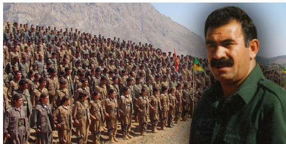
تصویر عبدالله اوجالان و گریلاهای پ.ک.ک

غیرنظامیان و زیرساخت‌های غیرنظامی به‌طور مستقیم در این حملات هدف قرار گرفتند. در حملات هواپیماهای جنگی، پهپادها و آتش توپخانه، مراکز بهداشتی و آموزشی، نانوائی‌ها، انبارهای آرد و غلات، سیلوهای گندم، نیروگاه‌ها، شرکت‌ها و کارخانه‌ها، شبکه‌های تلفن و ایستگاه‌های آب، گاز و نفت بمباران شدند.