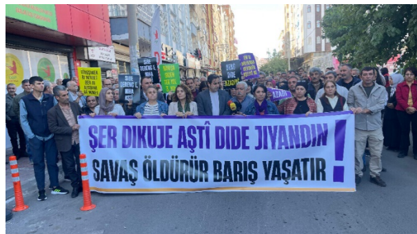
شعار روی باندرول تظاهرکنندگان در شهر آمد (دیاربکر) ترکیه: جنگ مرگ است و صلح زندگی

حملات ترکیه، در روژآوا و اقلیم کردستان عراق، همچنان ادامه دارد. اردوغان تلاش میکند افکار عمومی ترکیه را برای جنگ فراتر آماده کند. همزمان اردوغان و شرکای ناسیونالیست اش سعی میکنند توجه افکار عمومی را از واقعیت بحرانها و مشکلات داخلی منحرف کنند و بگویند که ترکیه در خطر است تا جنگ خود عیه مردم کرد در منطقه را گسترش دهند.