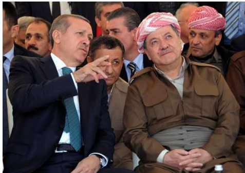
اردوغان و بارزانی

*بر اثر بمباران ارتش اشغالگر ترکیه، نیروگاه‌های برق در شهرها و مناطق کانتون‌های جزیر و فرات هدف قرار گرفت و بیش از ۱۵۰ هزار خانواده بدون برق ماندند. * ایستگاه‌های آب به دلیل قطعی برق از کار افتاده‌اند. * بمباران‌ها باعث نرسیدن سوخت گازوئیل به مراکز خدماتی مانند نانوائی‌ها و سایر مراکز خدماتی و در نتیجه بروز بحران سوخت شد.»