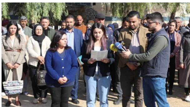
اتحادیه شهرداری‌های کانتون جزیر

همچنین شهرها و روستاهای تربسیه، تلتمر، زرگان، دیرک، عین عیسی و حومه آنها هدف قرار گرفتند. روستاهای منبج نیز از شمال تا غرب از صبح شنبه هدف حمله قرار گرفتند که در نتیجه یک کودک در روستای کاوکی منبج مجروح شد. در روستای چلبیه در جنوب کوبانی نیز پهپادهای ترکیه شرکت فرانسوی لاوراژ را بمباران کردند. ارتش ترکیه، همچنین شهر تل رفعت و روستاهای اطراف آن در کانتون شهبای را با بیش از ۶۰ گلوله خمپاره و توپخانه هدف قرار داد. بر اساس بیانیه مرکز رسانه‌های آسایش، شهرها و مناطق مختلف شمال و شرق سوریه در روز شنبه در مجموع ۹ بار با پهپاد بمب افکن و بیش از ۱۳۰ بار نیز با گلوله خمپاره و توپخانه هدف قرار گرفتند.