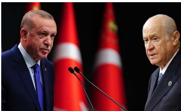
باغچلی و اردوغان شریک سیاسی همدیگر

این حمله، همچنین باعث منطقه‌ای شدن جنگ آنکارا با پ.ک.ک شد و بار دیگر آن را به خاک عراق برد و یک منطقه مهم بین‌سنگال و قندیل در عراق- محل مقر فرماندهی پ.ک.ک و حسکه در سوریه را هدف قرار داد. حسکه توسط یگان‌های مدافع خلق (YPG) کنترل می‌شود. این حمله از طریق حزب دموکرات کردستان عراق (KDP) وابسته به خانواده بارزانی که متحد اصلی کرد ترکیه و دارای روابط فشرده اقتصادی از جمله در مورد صادرات نفت است، امکان‌پذیر شد.