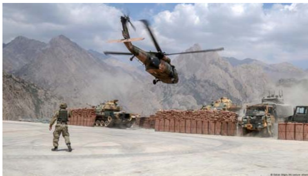
یک پایگاه مرزی ترکیه

به‌طور خلاصه، اصرار ترکیه برای جنگ علیه پ.ک.ک. در آن سوی مرز و روژآوا، تا زمانی که علل اصلی حل نشدن مسئله کردها همچنان رفع نشده باشد، زمینه را برای ادامه درگیری و بی‌ثباتی منطقه‌ای فراهم می‌کند. این جنگ نیز هزینه‌های زیادی نیز روی دست مردم ترکیه می‌گذارد.