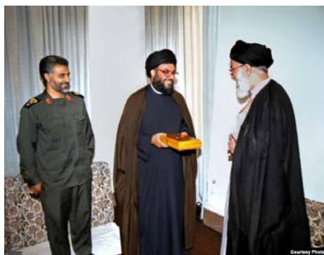
دیدار نصرالله با خامنه‌ای در حضور قاسم سلیمانی