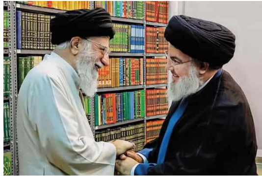
حسن نصرالله در دیدار با علی خامنه‌ای در تهران

از روز دوشنبه و در حملات اسرائیل به نقاط مختلف لبنان، ۷۰۰ لبنانی از جمله زنان و کودکان کشته شده‌اند. برخی منابع گفته‌اند که حمله روز جمعه می‌تواند تا بیش از ۳۰۰ کشته به همراه داشته باشد.