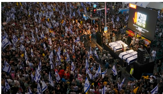
تظاهرات شهروندان اسرائیلی در شهر تل‌آویو

یوآو گالانت، وزیر دفاع اسرائیل، و داوید بارنیا، رئیس موساد، نیز پیش‌تر هشدار داده بودند که شرایط تازه‌ای که نخست‌وزیر اسرائیل وضع کرده است، مانع از دستیابی به توافق خواهد بود.