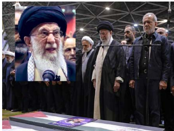
وحشت خامنه‌ای در مراسم تشییع هنیه

در واقع مرگ رئیس دفتر سیاسی حماس به‌عنوان یک شکست جدی برای اطلاعات ایران تلقی می‌شود. او پس از دعوت به‌عنوان مهمان برای مراسم تحلیف رئیس جمهور به تهران آمده بود. نمایندگان ۸۰ کشور دیگر نیز در این مراسم حضور داشتند. پروتکل‌های امنیتی برای چنین رویدادهایی باید در بالاترین سطح تهیه شوند.