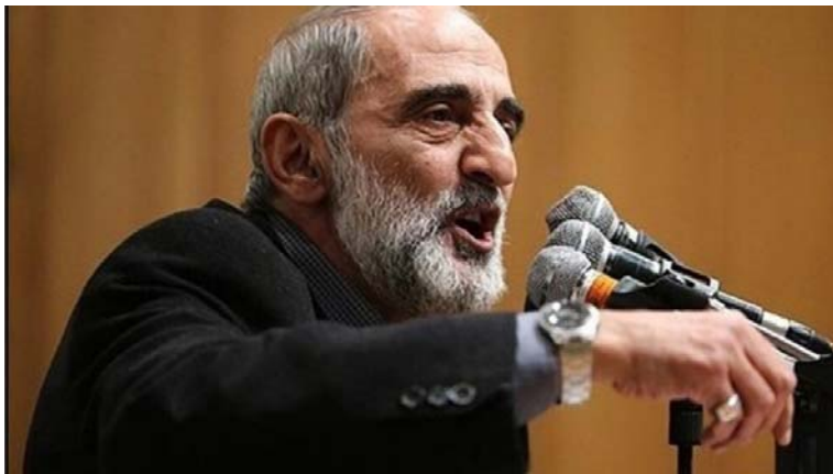
حسین شریعتمداری، نماینده رهبر جمهوری اسلامی در روزنامه کیهان

حسین شریعتمداری، مدیر مسئول روزنامه کیهان، از رهبران جمهوری اسلامی ایران خواسته است که در خونخواهی اسماعیل هنیه، رهبر کشته شده حماس در تهران، امریکا را "از فهرست انتقام حذف" نکنند.