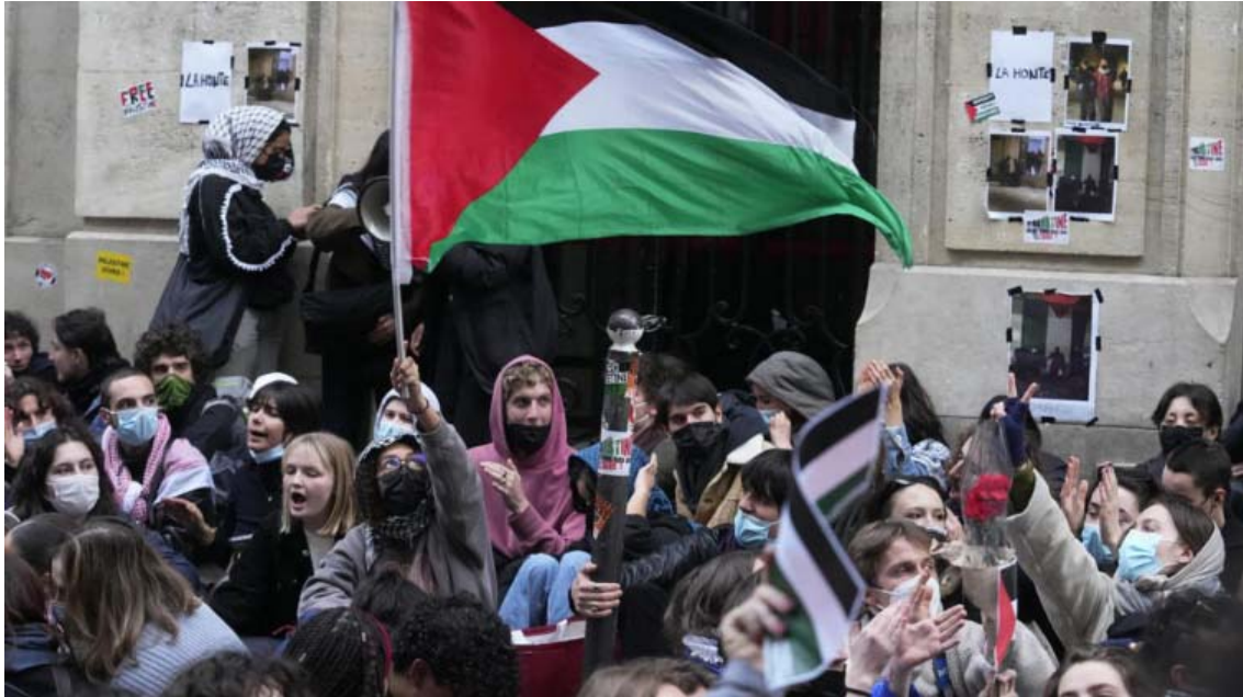
تجمع دانشجویان مطالعات سیاسی پاریس (سیانس پو) در حمایت از فلسطینیان

بامداد روز پنجشنبه دوم مه-۱۳ اردیبهشت، گردشگرانی که در کنار رود سن قدم می‌زدند، نوشته‌های بزرگی را در نزدیکی برج ایفل دیدند که «آتش‌بس در غزه» و «توقف تحویل سلاح» به همه طرف‌های جنگ را خواستار شده بودند. این پتوهای بزرگ از جمله توسط سه سازمان معتبر عفو بین‌الملل، آکسفام و پزشکان جهان نصب شده بود. در همین ساعات، در دانشگاه‌های چند شهر فرانسه، تظاهرات دانشجویی مانع از برگزاری کلاس‌ها شد. مدیریت موسسه مطالعات سیاسی شهر لیل اعلام کرد که این مدرسه تمام روز پنجشنبه بسته خواهد بود. مدرسه عالی روزنامه‌نگاری شهر لیل نیز که یکی از معتبرترین مدارس روزنامه‌نگاری فرانسه به شمار می‌آید، به دلیل تجمع دانشجویان عملاً تعطیل شده است.