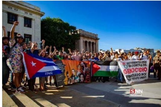
تجمع دانشجویان هاوانا

بر اساس گزارش ضبط شده ای از جلسه ای که به دست اینترسپت رسیده است، هر دو نماینده از همکاری دانشگاه‌هایی که از پولیس می‌خواهند اعتراضات خشونت‌آمیز را سرکوب کنند، ستایش کردند و قول دادند که کنگره برای تحقیق در مورد جنبش‌های دانشجویی تلاش خواهد کرد. در دو هفته گذشته، تظاهرات دانشجویان به بیش از ۱۵۰ دانشگاه گسترش یافته است.