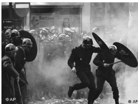
پاریس، ۶ مه ۶۸

جنبش مه ۶۸ تأثیر عمیقی بر جامعه فرانسه و به‌طور کلی بر اروپا داشت. با این‌که جامعه‌شناسانی مانند ریمون آرون آن را منفی ارزیابی کرده و نگران آن بودند که این جنبش وجهه فرانسه را در میان کشورهای دیگر تخریب کند، تاریخ عکس این ماجرا را نشان داد و مه ۶۸ فرانسه همانند واقعه‌ای مثبت و آزادی‌خواهانه در افکار روشنفکران کشورهای جهان نقش بست.