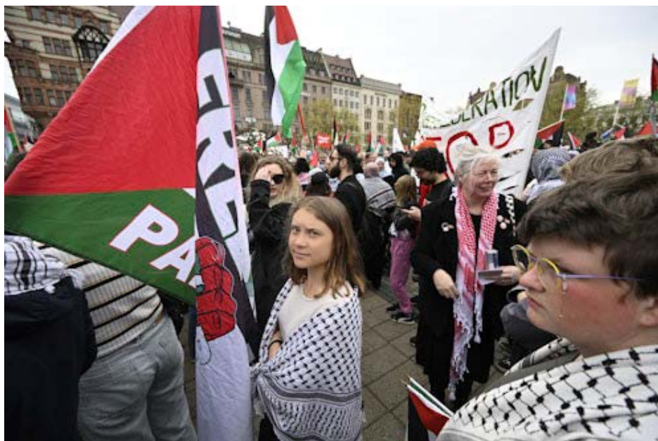
گرتا تونبرگ پشت پرچم فلسطین

گرتا تونبرگ به تجمع معترضان سویدنی علیه حضور اسرائیل در مسابقه آواز یوروویژن پیوست. گرتا تونبرگ، فعال محیط‌زیستی و چهره جهانی در این عرصه، روز پنج‌شنبه ۹ مه در میان بیش از ۱۰ هزار معترض حامی فلسطین که در شهر مالمو سویدن علیه شرکت اسرائیل در مسابقه آواز یوروویژن تجمع کرده بودند، حضور یافت. تونبرگ به همراه هزاران معترض دیگر که در میدان اصلی مالمو جمع شده بودند در حالی دست به تظاهرات زدند که نماینده اسرائیل با وجود اعتراض‌ها سرانجام موفق به راهیابی به مرحله نهائی این مسابقه آواز خوانی شد.