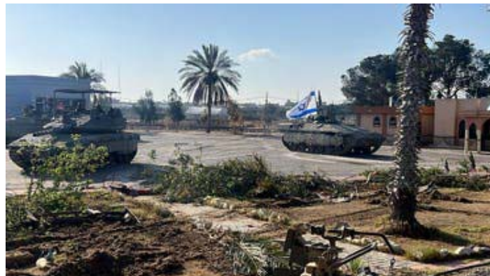
تانک‌های اسرائیلی در گذرگاه‌های مصر و شهر فلسطینی رفح

آژانس آنروا وابسته به سازمان ملل گزارش داد که از ششم ماه جاری حدود ۸۰ هزار فلسطینی از رفح آواره شده‌اند و همچنین هشدار داد که در هیچ جای نوار غزه مکان امنی وجود ندارد.