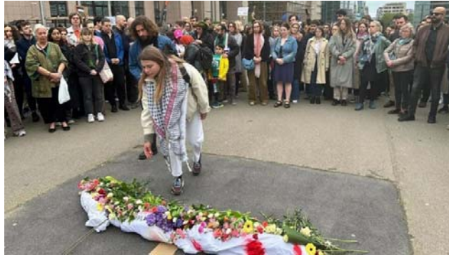
«تشییع جنازه» نمادین