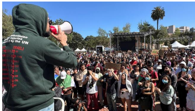
تجمع دانشجویان طرفدار مردم فلسطینی در کالیفرنیا

موقوفات دانشگاهی همه چیز را از آزمایشگاه‌های تحقیقاتی گرفته تا کمک هزینه‌های تحصیلی تامین می‌کنند، که عمدتاً از بازده میلیون‌ها - و میلیارد‌ها - دالر سرمایه‌گذاری استفاده می‌کنند. آن‌ها مالک سهام شرکت‌های بزرگ از آمازون گرفته تا مایکروسافت هستند و در سهام خصوصی، صندوق‌های پوششی و صندوق‌های شاخص سرمایه‌گذاری می‌کنند.