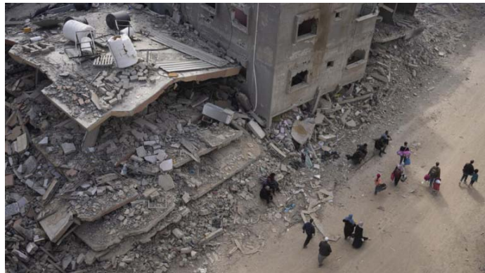
تصویری از ویرانه‌های خان یونس در نوار غزه

سازمان ملل هزینه بازسازی نوار غزه را بین ۳۰ تا ۴۰ میلیارد دلار برآورد کرد. سازمان ملل روز پنج‌شنبه ۲ ماه مه-۱۳ اردیبهشت، سطح ویرانی‌ها در غزه را «بی‌سابقه» دانست و اعلام کرد که هزینه بازسازی نوار غزه که در طول جنگ میان اسرائیل و گروه حماس به ویرانه تبدیل شده، بین ۳۰ تا ۴۰ میلیارد دلار برآورد شده است.