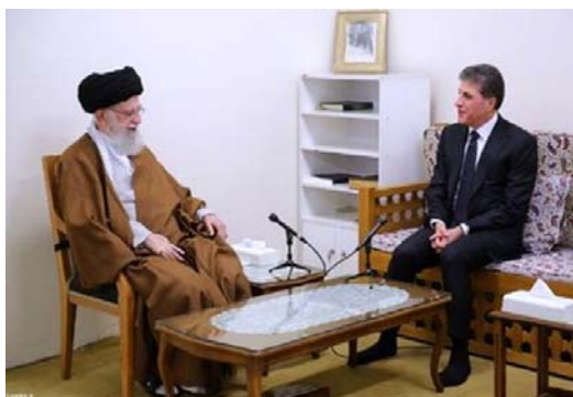
دیدار ابراهیم رئیسی و نیچروان بارزانی در تهران

این در حالی است که طالبانی همکاری‌های نزدیکی با ایران بعد از قرارداد امنیتی ایران و عراق داشت و همان زمان سفر طالبانی به تهران، «احمد الهرکی» از مسؤولان ارشد اتحادیه میهنی کردستان عراق به پایگاه العربی الجدید گفته بود: «سفر بافل طالبانی رئیس این حزب به تهران در ارتباط با پرونده احزاب مخالف کرد ایرانی (گروه‌های مسلح تروریست) که در داخل اقلیم کردستان عراق حضور دارند، موفقیت‌آمیز بود و طالبانی نقش مهمی برای یکسره و نهائی کردن این پرونده بازی کرد.»