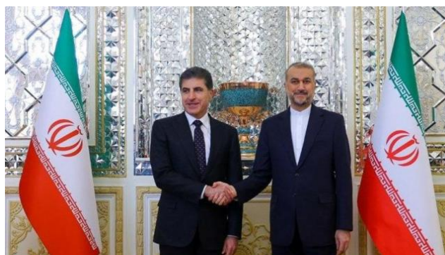
دیدار عبدالهیان و بارزانی

از آن هنگام فشار حکومت ایران بر اقلیم کردستان بیش‌تر شد و سپاه پاسداران بارها با پهپاد و راکت به پایگاه‌های احزاب کرد در اقلیم کردستان حمله کرد.