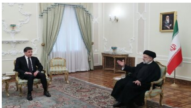
دیدار ابراهیم رئیسی و نیچروان بارزانی در تهران-ایرنا

سفر نیچروان بارزانی به تهران، بعد از سفر اردوغان به اقلیم و در میانه منازعه سیاسی احزاب کرد اربیل و سلیمانیه حول انتخابات پارلمان اقلیم کردستان عراق صورت گرفت و او با مقامات عالی‌رتبه جمهوری اسلامی ایران دیدار کرد.