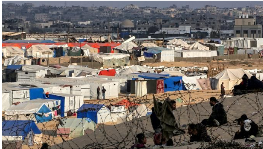
غیرنظامیان فلسطینی در رفح در انتظار بدترین وضعیت

حرکت می‌کنند، راکت شلیک کنند و از این طریق آن را در موقعیت محاصره قرار دهند. حملات هوایی امریکا و انگلیس علیه انصارالله، با وجود تمام گزارش‌های تحسین‌آمیز، تأثیر جدی نداشته است.