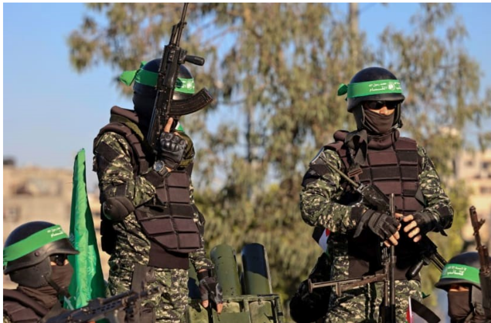
حماس مسلح نیز منتظر حمله است

تمام تلاش‌های واشنگتن برای حفظ حداقل برخی از مواد در حال سوختن توافق‌نامه ابراهیم برای عادی‌سازی روابط بین کشورهای عربی و اسرائیل به طور کامل شکست خواهد خورد. هیچ یک از آن کشورها، از جمله، عربستان سعودی و اردن طرفدار غرب، نمی‌توانند با حفظ خط کنونی اسرائیل بدون خطر برانگیختن اعتراضات جدی مردمی در داخل کشورهای خود در ترویج این روند مشارکت کنند. ملک عبدالله دوم، پادشاه اردن به عنوان یک انگلیس از طرف مادر، قصد دارد در سفر قریب‌الوقوع خود به امریکا شخصاً این موضوع را بیان کند.