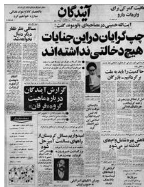
تصویر روزنامه آیندگان که خمینی را خشمگین کرد

این جمله‌ها بخشی از سخنرانی خمینی است، پس از مدتی کشاکش میان او و روزنامه «آیندگان»؛ خمینی در اردیبهشت ۵۸ پس از ترور حجت‌الاسلام «مرتضی مطهری» در مصاحبه با روزنامه «لوموند» گفته بود که چپ‌ها در این ترور نقشی نداشتند و همین گفته، تیتر روزنامه شد. ۲۰ اردیبهشت خمینی اعلام کرد، دیگر این روزنامه را نخواهد خواند. شماره بعدی آیندگان با یک مقاله و سه صفحه سفید منتشر شد و تا ۴ روز آیندگان منتشر نشد تا بالاخره ۱۶ مرداد، آیندگان را توقیف کردند. خمینی ۲۶ مرداد سخنرانی کرد و از شکستن قلم‌ها گفت و در روزهای ۲۸ و ۲۹ مرداد به دستور او، دست‌کم ۲۳ نشریه تعطیل شدند. صحبت‌های او در سخنرانی ۲۶ مرداد، آغازی شد برای شکستن قلم‌ها و کشتن قلم‌به‌دستان.