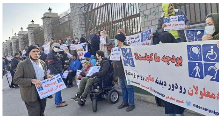
تجمع سراسری معلولان در سال ۱۴۰۲