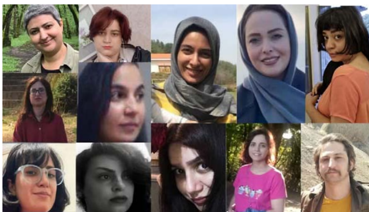
یازده تن از کنشگران جنبش زنان در گیلان

در سیاست اجتماعی نیز خیلی زود آنچه را که از روز اول آشکار بود به گونه‌ای پیاده کردند که خانم «انسبه خزعلی» که فقط و فقط فکر و ذکرش گرم کردن لحاف تولیدمثل و افتخارش ازدواج در ۱۶ سالگی است، در حاشیه ساختار دولت حضور دارد و ۵۰ درصد از جمعیت کشور را با امرونی‌های مبهم و تفاسیر فردی اداره می‌کند. این سال‌ها، فشار بر جامعه زنان کشور روبه فزونی گذاشته است.