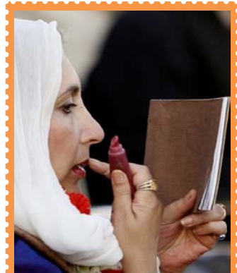
عکسی از AP که خانم بوتو را در حال آماده شدن برای حضور در آخرین سخنرانی اش در راولپنڈی در روز ۲۷ دسامبر سال ۲۰۰۷، نشان می دهد.

چک سفیدبود، امتیاز مطلق بود. "برای بوتو، هدف آن بود که افغانستان جدید زیر یوغ پاکستان و خارج از اعمار هند قرار گیرد. احمد شاه مسعود، "رهبر اتحاد شمال"، از این زاویه برای او مطلوب نبود، چرا که به هند خیلی نزدیک بود. از این رابطه [پاکستان با افغانستان] می شد که با سرازیر کردن امکانات صنعت حمل و نقل پاکستان، کابل را - این جاده ابریشم نوین که بازارهای آسیای مرکزی را در بر میگرفت- از خط لوله نفت از ترکمنستان (که تحقق نیافت) و کمپ های آموزشی جنگجویان جدائی طلب کشمیر در خارج از پاکستان، ممانعت کرد. بوتو یک دیدگاه و نقشه سیاسی و اقتصادی برای پاکستان داشت که مبتنی بر خلق یک