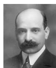
پاول موریتس واربورگ- بنیامین استرانگ- نلسون آلدریچ- آبراهام پیات آندرو- چارلز نورتون فرانک واندرلیپ