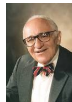
مورای روت بارد

با ورود ویلسون به کاخ سفید مقدمات تهیه و تنظیم لایحه تأسیس فدرال رزرو علی رغم مخالفت‌های بسیار آغاز می گردد. چارچوب طرح ابتدائی در ۱۸ سپتمبر ۱۹۱۳ با اعمال فشار ویلسون بر اعضای کنگره به تصویب کنگره و روز