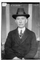
ادوارد ماندل هاوس

ویلسون با ۴۸ درصد آراء و در شرایطی که ۵۲ درصد آراء علیه او بود به کاخ سفید می رود. همراه با او یک عالیجناب خاکستری هم وارد کاخ می شود. "ادوارد ماندل هاوس" Edward Mandell House یک استاد اعظم فراماسونری ، رفیق گرمابه و گلستان مورگان و جاسوس روتشیلدها ، از اعضای مؤسس انستیتوی سلطنتی مسائل بین المللی ( RIIA ) و شورای روابط خارجی ( CFR ) . او برای مدت شش سال یعنی تا پایان جنگ جهانی اول و پایان مأموریتش ، همواره دو اتاق در ضلع شمالی کاخ سفید را در اختیار دارد بی آن که دارای یک شغل رسمی باشد ! او ظاهراً مشاور رئیس جمهور در امور بین المللی بوده است !