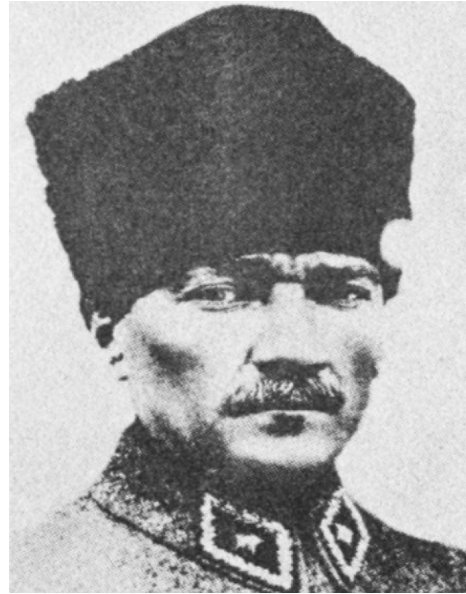
کمال اتاتورک بنیان‌گذار ملی‌گرای جمهوری ترکیه که مخالف نفوذ اخوان‌المسلمین در ترکیه بود