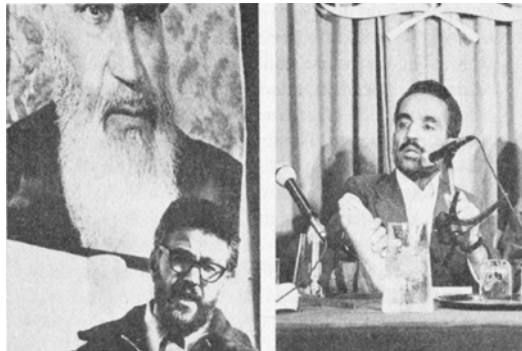
بنیادگرای جمهوری اسلامی ایران. ابراهیم یزدی آموزش دیده زیست محیطی از امریکا و در سمت راست رجائی نخست وزیر بنیادگرای رژیم. ادامه دارد