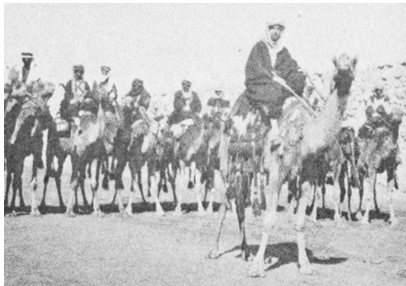
سنت جان فیلی (پدر کیم فیلی) مأمور انگلیس در شبه جزیره عربستان سعودی بر روی شتر در بیابان‌های عربستان در سال ۱۹۱۷