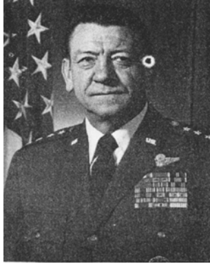
سر هنگ رابرت هوایزر