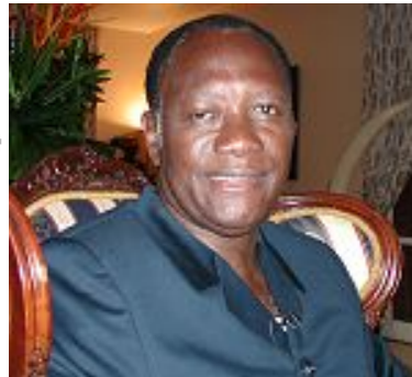
آلاسان و اتارا

فرانسوا هولاند : مقامات مالی ما را مطلع ساخته‌اند، در نتیجه نباید وقت را تلف کرد، و فرانسه، در اینجا اعلام می‌کند، از تمام اقداماتی پشتیبانی خواهد کرد که به آفریقایی‌ها اجازه دهد، که خودشان این مسأله را حل کنند در چهار چوب قوانین بین‌المللی با مجوز قاطع شورای امنیت، بلکه مالی باید بر تمامیت ارضی اش حاکم شود، و تروریست‌ها از منطقه‌ی ساحل رانده شوند.