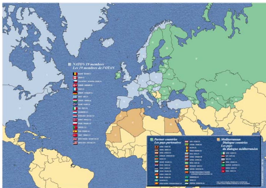
نقشه اعضای ناتو

در سال ۲۰۰۴، ابتکار دیگری برای همکاری توسط ناتو، و این بار، با ترکیه منعقد گردید. اتحادیه استانبول در واقع به شورای همکاری خلیج ضمیمه شد(۲). اتحادیه استانبول بخشی از گفت و گوی مدیترانه که مأموریت مشابهی را در خارج از منطقه جغرافیایی خلیج فارس به عهده گرفت. این دو اتحادیه به تدریج اتحادیه برای مدیترانه را تقویت کردند.