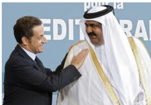
سرکوزی و امیر قطر، حامد بن خلیفه آل ثانی در پاریس، گردهمائی اتحادیه برای مدیترانه، ۱۳ جولای ۲۰۰۸

خواست رسمی برای ایجاد اتحاد بین کشورهای ساحل مدیترانه، با تلاش های نیکلا سرکوزی تحول یافت. در سال ۲۰۰۸، تلاش ها رسماً با ایجاد [اتحادیه برای مدیترانه] با شرکت ۲۷ کشور اروپائی و ۱۶ کشور همسایه در افریقای شمالی و خاور میانه به نتیجه رسید. به این اساس، اتحادیه نوین منطقه ئی اهداف جدیدی برای ضمیمه سازی اقتصادی و دموکراتیک ۱۶ کشور دیگر را در برنامه خود به ثبت رساند.