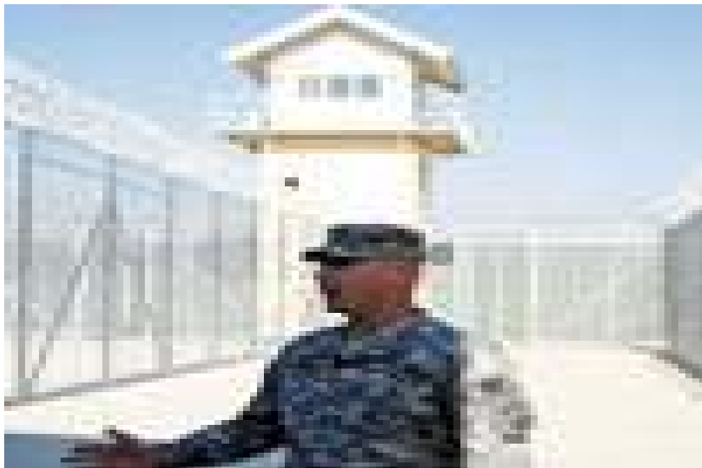
برج مراقبت زندان بگرام