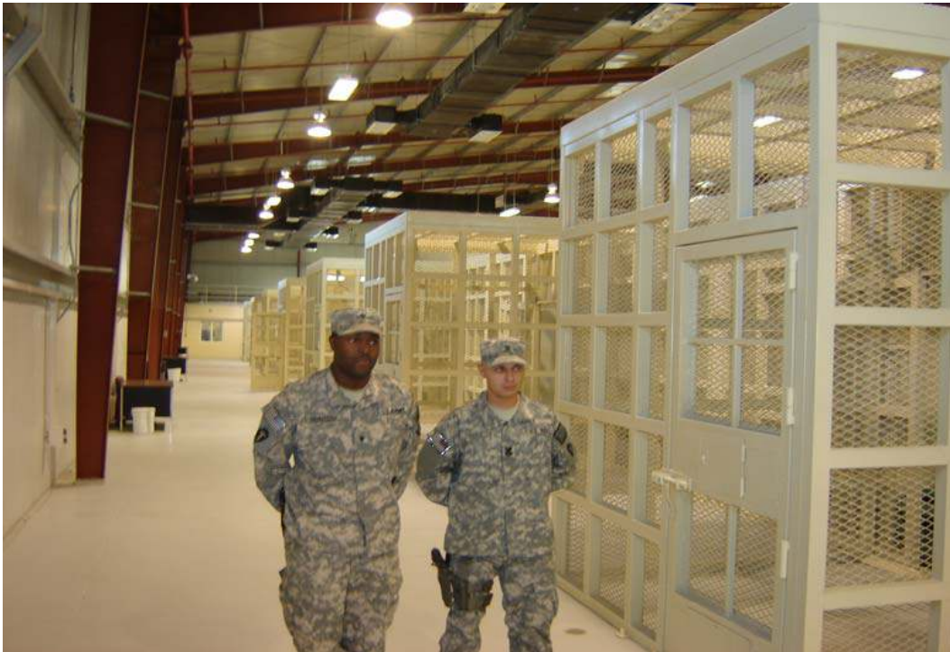
دروازه قفس بطرف دست چپ سرباز