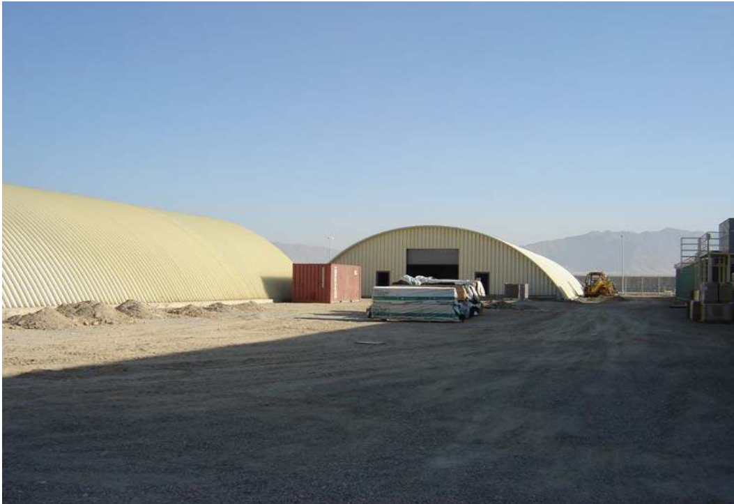
نمای بیرونی زندان جدید