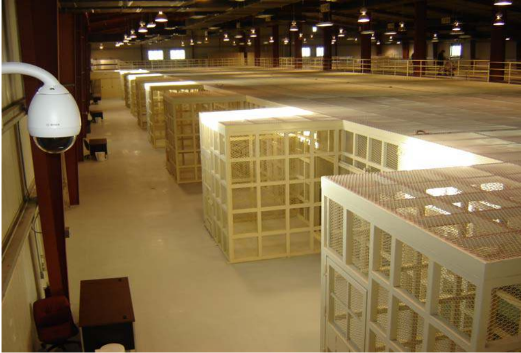
یک پایه میز و چوکی که کمره در بالای آن نصب شده در برابر دروازه هر قفس دیده میشود .