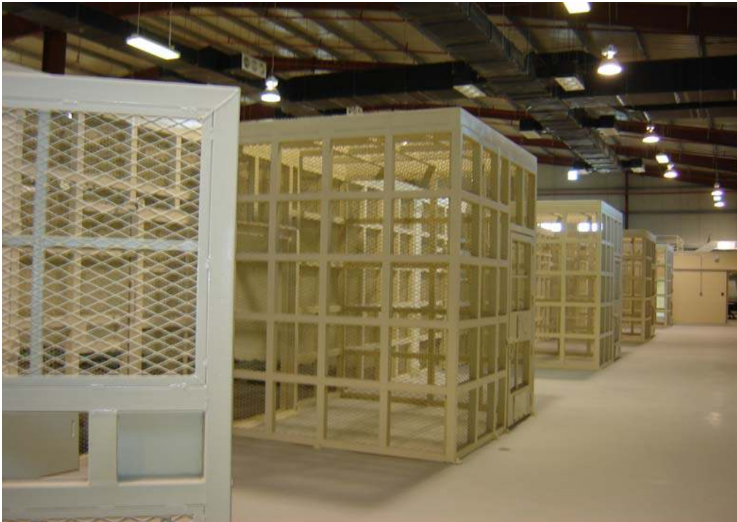
نمای از دروازه های قفس های اصلی