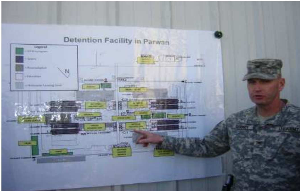
آیا این نقشه اصلی زندان است ؟