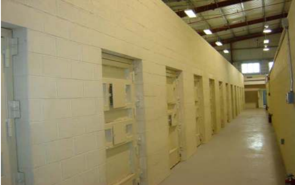
به امر سرباز ، زندانی از دریچه گک بالایی دروازه کوتاه قفلی هر دودست اشرا بیرون میکند تا سرباز به آن الچک بزند . بعد از آن دروازه کوتاه قفلی باز شده زندانی به دهلیز کشیده میشود