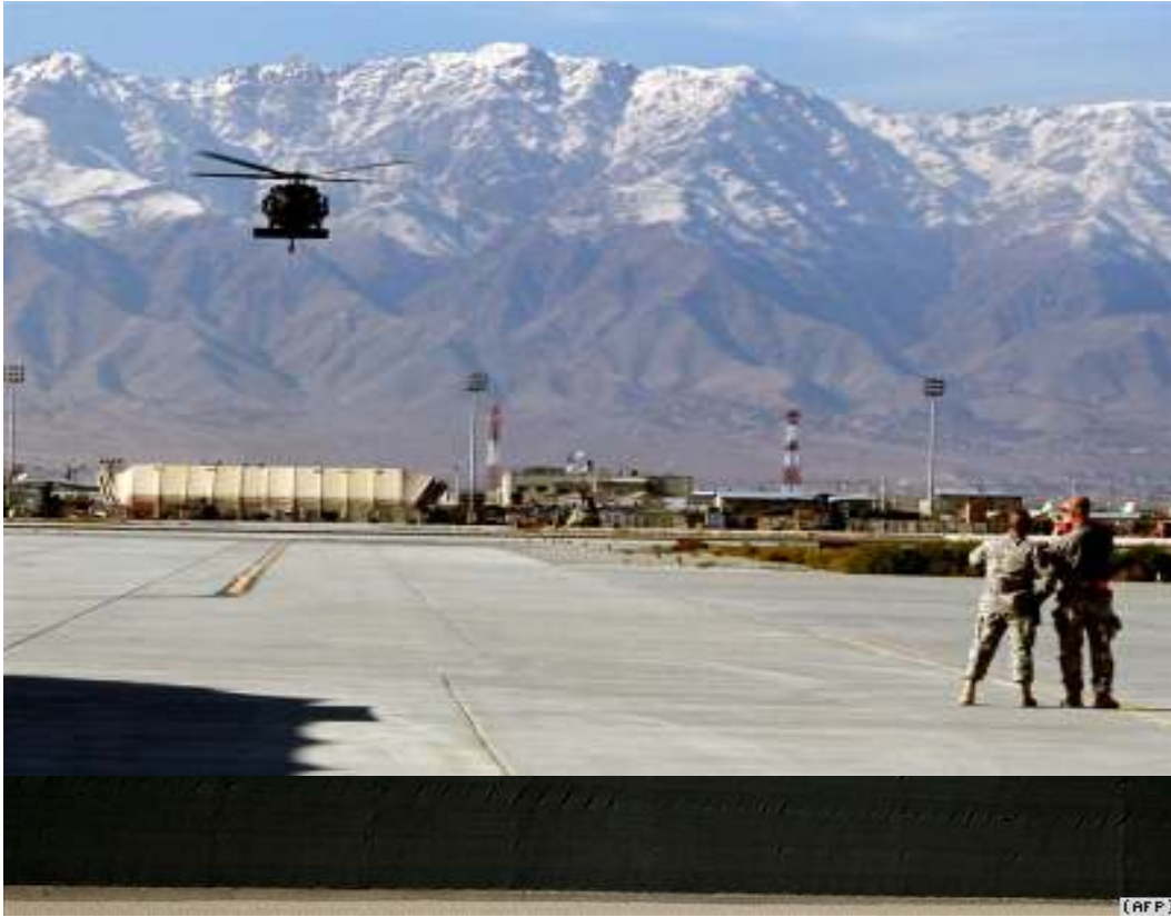
نمای از میدان هوایی بگرام

برج‌های مراقب زندان جدید میدان هوایی بگرام (بارنگ سیاه مانع دیدن داخل زندان شده اند)