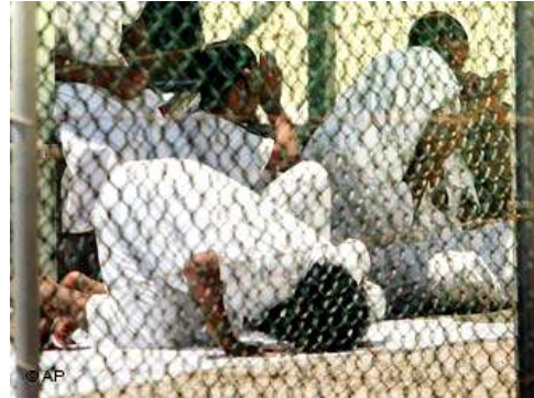
زندانیان پلچرخي پس از سه روز اعتصاب