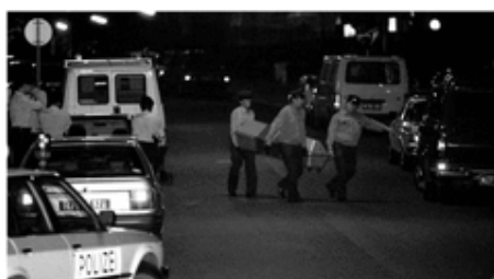
انتقال اجساد کشته شدگان