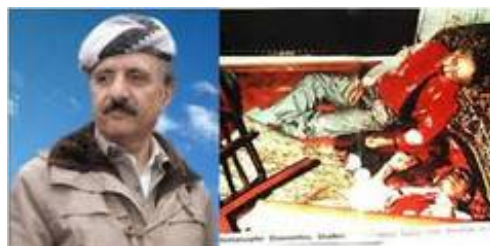
قاسملو و تصویر محل جنایت

تروریست ها مزدوران جمهوری اسلامی بودند که در پوشش دیپلمات و به ظاهر برای رایزنی با او (حزب دمکرات کردستان) جهت یافتن راه حلی مسالمت آمیز برای کردستان آمده بودند. این جلسه سومین جلسه قاسملو با نمایندگان جمهوری اسلامی بوده گفته شده است که تیم رایزنی و تیم ترور تفاوت داشته اند اما اظهر من الشمس است که همه آنها مزدور رژیم و عوامل ترور بوده اند. بخشی از آنها پس از انجام این جنایت به سفارت رژیم در این شهر که در نزدیکی محل ترور نیز هست رفته و توسط این سفارت به ایران پرواز می کنند.