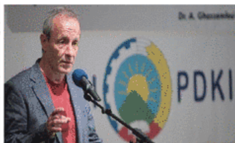
پتر پیلز نماینده سبزها در پارلمان که سالها پیگیر حقیقت بود