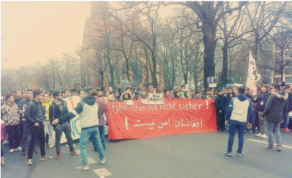
تظاهرات در برلین علیه پس فرستادن پناهجویان به افغانستان - ۱۰ دسمبر ۲۰۱۶

مبنای اداری برای ارجاع های در نظر گرفته شده قرار می‌گیرد است میان المان و افغانستان و نیز میان افغانستان و اتحادیه اروپا که در دوم اکتوبر در کابل به امضاء رسید. مطابق این قرار افغانستان بازگرداندن پناهجویانی را که تقاضاهایشان رد شده باشد، می‌پذیرد. افغانستان از جمله موظف است اسناد لازمه را بدون تأخیر آماده نماید. در مواردی که کابل موفق بدین کار ننگردد، اتحادیه اروپا مستقلاً اسناد مزبور را صادر می‌نماید که طبق قرار، محترمانه، مطمئن و مرتب انجام خواهد شد. [۱] در تکمیل این کار از یک سو کوشش های بیشتری در جهت جذب افراد و از سوی دیگر اقدام تبلیغی علیه فرار افغانها به اتحادیه اروپا در نظر گرفته شده است. برلین یک چنین عملیات سازمان یافته ای را در پائیز سال جاری آغاز نموده، با نصب پلاکات هائی در افغانستان منتشر ساخته بود که افغانها غالباً سال ها در المان اجازه کار دریافت نمی‌کنند، خردسالان را نیز پس خواهند فرستاد و در المان فقط به نیروی کار آزموده نیاز است و نه به کارگر ساده. [۲] تبلیغات مزبور، همانطور که تداوم فرار افغانها نشان می‌دهد، فایده ای نداشته است. اکنون دیگر کابل باید انجام این کار را خود بر عهده گیرد.