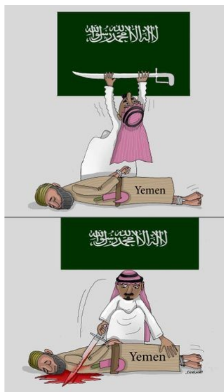
کاریکاتور از عتیق الله شهید

از آن زمان به عملیات جنگی ائتلاف تحت رهبری عربستان سعودی در یمن مرتب ایرادات شدیدی وارد می گردد. ریاض در همان ۲۶ مارچ ۲۰۱۵ بلافاصله پس از اولین بمباران ها یمن را به محاصره بحری در آورد و تقریباً به کلی از رسیدن واردات محروم ساخت، به طوری که عواقب آن به سختی قابل تحمل بود. یمن تا آن زمان مجبور بود ۸۰ درصد آذوقه خویش را از محل واردات تأمین نماید، شامل بر ۹۰ در صد گندم و صد در صد برنج مورد نیاز [۸]. از آغاز محاصره فقط بخش کوچکی از واردات مورد نیاز به کشور می رسد. علی رغم کمک های ملل متحد و سازمان های کمک رسان مختلف، کمبود شدید مواد غذایی، سوخت و دارو جات بر یمن حاکم است. از ۲۶ میلیون اهالی این کشور در این بین ۲۱,۲ میلیون یعنی ۸۲ درصد مردم به رسیدن کمک های انساندوستانه وابسته بوده، ۱۴,۴ میلیون به خواراک کافی دسترسی ندارند. حتا ۷,۶ درصد مردم به کمبود شدید مواد غذایی دچارند. ۱,۵ میلیون کودک در ضعف تغذیه به سر می برند. ۳۷ هزار آنها شدیداً با کمبود مواد غذایی مواجه اند. به تازگی سازمان تغذیه وابسته به ملل متحد اعلام خطر نموده است. بنا بر این اخطار سازمان های کمکی علی رغم کوشش های فراوان فقط قادر به رفع محدود این احتیاج مبرم می باشند. لذا باید از همه امکانات برای عادی سازی مجدد تأمین آذوقه و نظام بهداری آنجا استفاده نمود. البته تحقق این کار وابسته بدان است که عربستان سعودی که از متحدان محوری غرب در خاور نزدیک می باشد از محاصره ای که از یک سال و نیم پیش اعمال نموده است، دست بردارد.