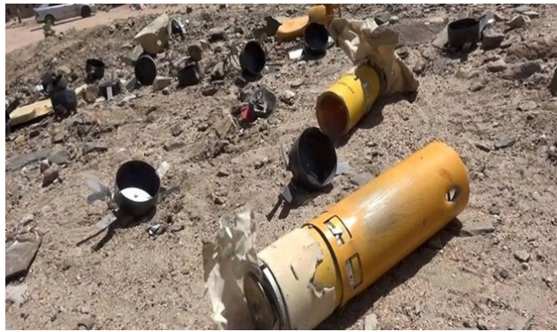
تصویر بمب خوشه‌ئی از المیادین- ۲۸ مه ۲۰۱۶

قرار گرفت و دستکم ۷ کودک در سنین ۶ تا ۱۴ سالگی کشته شده، کودکان مجروح به بیمارستانی انتقال یافتند. چند روز پیش تر صندوق کودکان ملل متحد اعلان نموده بود که از زمان آغاز جنگ ۱۱۲۱ کودک کشته شده اند. بنا بر اطلاعات ملل متحد در یمن مجموعاً ۴۰۱۲۵ غیرنظامی جان خود را از دست داده اند که قریب به ۶۰ درصد آنان، یعنی کشته شدن بیش از ۲۴۰۰ نفر به دنبال حملات هوایی نیروهای عربستان سعودی بوده است. در ماه اگست ناظران حقوق بشر و عفو بین المللی اطلاع دادند که فقط این دو سازمان شمار ۷۰ حمله هوایی ناقض حقوق بین المل را مستند به ثبت رسانده اند، حملاتی که منجر به کشته شدن ۹۰۰ غیر نظامی گشته اند. علاوه بر آن آنها در ۱۹ حمله به کار بردن مهمات خوشه‌ئی را مستند ساخته اند [۹]. حنا کارخانجات داروسازی، انبارهای مواد غذایی و بیمارستان هائی که مختصات جغرافیائی (جی پی اس) آنها را پزشکان بدون مرز مستقلاً اعلام نموده بودند بمباران شده اند [۱۰]. بنا بر تحقیقات به عمل آمده یک سوم بمباران هائی که توسط نیروهای هوایی ائتلاف تحت رهبری عربستان سعودی صورت گرفته است، به اهداف غیرنظامی بوده است [۱۱]. آخرین این بمباران ها به سالی بوده است که در آن بیش از ۱۰۰۰ تن برای انجام سوگواری جمع شده بودند. در این جنایت جنگی عربستان سعودی شمار ۱۴۰ کشته به آمار قربانیان حملات این کشور افزوده گشت.