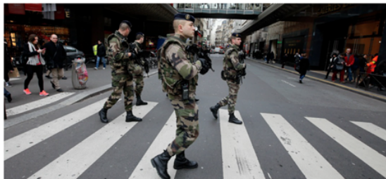
Des militaires français marchent dans les rues de Paris dans le cadre du plan Vigipirate, en janvier 2015.

Rubin Pirelli France 02.10.2015 - 10 h 45 mise à jour le 02.10.2015 à 12 h 45