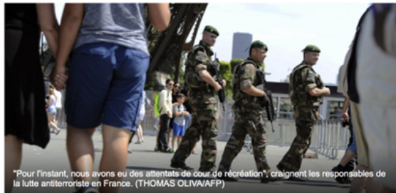
"Pour l'instant, nous avons eu des attentats de cour de récréation", craignent les responsables de la lutte antiterroriste en France.

Les experts et les responsables de la lutte antiterroriste craignent que la France ne soit la cible de nouveaux attentats "impossibles à déjouer".