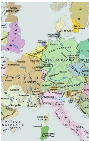
نقشه اروپا بر مبنای ملت های فاقد مرز از اتحاد آزاد اروپائی

مواضع پان کاتالانیائی را سازمانی تأیید می کند که با حزب سبزهای المان در پارلمان اروپا همکاری دارد. اتحاد آزاد اروپائی EFA که اتحادی از احزاب موجود در چندین کشور اروپائی می باشد و اقلیت های زبانی و گویشی را نمایندگی می کند، خواهان حق تعیین سرنوشت برای اقلیت های قومی در سراسر اروپا می باشد. اتحاد مزبور سالهاست نقشه اروپای ویژه ای را مطرح می سازد [۵] که ملت های بدون کشور را فهرست کرده است. از مشخصات نقشه مزبور این که از جمله پولند تحلیل می یابد. مطابق این نقشه پولند موطن ملت های کاشوب و شلیزی را از دست خواهد داد. فرانسه باید از جمله از بریتانی (قوم بریتان در اکستیان) واقع در جنوب این کشور و نیز از الزاس چشم پوشی نماید. و اسپانیا نه فقط کاتالانیا را از دست می دهد، بلکه همچنین آندالوس، گالیز، سرزمین باسک ها و بخش های دیگری را نیز باید رها سازد. از جانب دیگر کاتالانیا با منطقه والنسیا و بخشی از جنوب فرانسه به هم پیوسته و بارسلون را نیز شامل می گردد. بزرگترین ملت فاقد کشور المان می باشد: بدین ترتیب که المان با اتریش با هم یکی شده، لوکسامبورگ و استان شمالی ایتالیا، موسوم به تیرول جنوبی نیز بدان افزوده و بخشی از سوئیس را نیز در بر می گیرد. در تصویر ضمیمه که توسط سازمان جوانان EFA منتشر می شود، بخشی از نقشه اروپا دیده می شود.