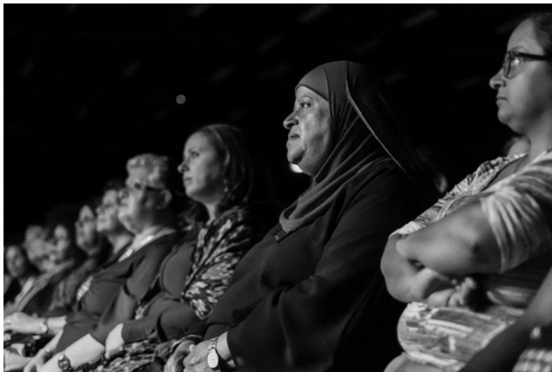
همایش یادبود ۲۰۱۴

گروهی از اشغالگران کوشیدند همایش دهمین سالگرد مشترک اسرائیلیان و فلسطینیان را که همه ساله توسط «مبارزان راه صلح» و «مجمع گفت و گوی والدین» در ۲۱ اپریل تشکیل می شود، غیرممکن سازند. قرار بود این گردهمایی در ۲۱ اپریل صورت گیرد. «شورای اشغالگران ساماریا» از وزارت دفاع اسرائیل درخواست نمود که به شرکت کنندگان فلسطینی اجازه شرکت در این یادبود را که در روز ملی اسرائیل برگزار می گردد، ندهد. قرار بود سخنگویان این همایش از بازماندگان خانواده های هر دو طرف باشند. شورای اشغالگران ساماریا همان گروهی است که در آغاز سال جاری ویدیویی را تولید نموده بود که در آن تصاویر سامی ستیزانه را برای القاء این که گروه های حامی حقوق بشر توسط نازی ها تأمین مالی می کردند، به کار برده بود. در نامه ای که آنها برای وزیر دفاع نوشته بودند به فلسطینیانی اشاره شده بود که در سالگرد مشترک مزبور شرکت می جستند و آنها را خویشاوندان قاتلان معرفی نموده بودند. علاوه بر آن گروه مزبور از وزیر دفاع خواهان این شده بود که قوای مقننه این گونه گردهمایی ها را ممنوع سازد.