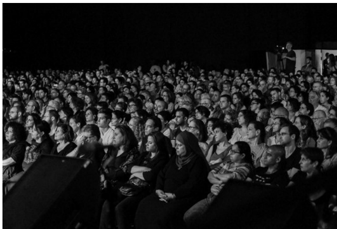
همایش یادبود ۲۰۱۴

دو سال پیش پاسخ درخواست ۲۰۰ تن از فلسطینیان برای شرکت در این همایش منفی بود و فقط با تهدید مراجعه نمودن به بالاترین مرجع قضائی و با دخالت شماری از نمایندگان کِنِسِت، سرانجام وزارت دفاع به ۴۰ تن اجازه داد.