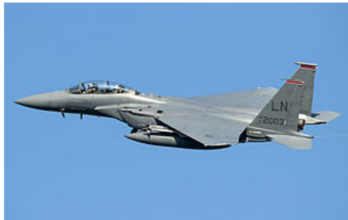
اف-۱۵ ائی نیروی هوایی امریکا

چه نوع هواپیما هائی در این عملیات هوایی درگیرند؟ جنگنده فالکون اف-۱۶ ( F-16 Fighting Falcon )، (در بالا)، ضربت عقاب اف-۱۵ ( F-15E Strike Eagle ) (در پائین)، گراز ای-۱۰ ( A-10 Warthog )، لازم به ذکر نیست که از هواپیمای جنگنده تاکتیکی راپتور نهران/مخفی لاکهید مارتین اف-۲۲ نام برد.