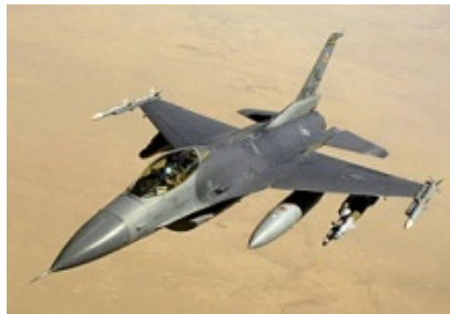
اف-۱۶ جنگنده فالکون

بنابراگزارش شورای روابط خارجی ماکس بوت، پاسخ، تشدید عملیات نظامی است: چیزی که رئیس جمهور احتیاج دارد "اعزام هواپیماهای بیشتر، مشاوران نظامی، و نیروهای عملیات ویژه است، و باید محدودیت هائی را که تحت آن عمل می شود شل کرد." (همانجا)