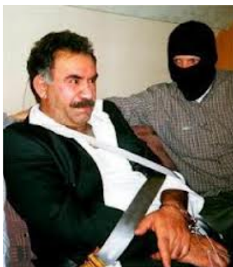
عبدالله اوجالان به هنگام دستگیری و انتقال به ترکیه

یک دهه بعد «گوردون توماس» از عناصر اطلاعاتی سازمان «سیا» که رابطه نزدیکی با «موساد» دارد در کتاب خود نوشت: «اساساً دستگیری «اوجالان» نه توسط نیروهای امنیتی امریکا و ترکیه، بلکه مستقلاً توسط سازمان موساد اجراء شد و آنان پس از ربودن وی او را به ترکیه تحویل دادند.»