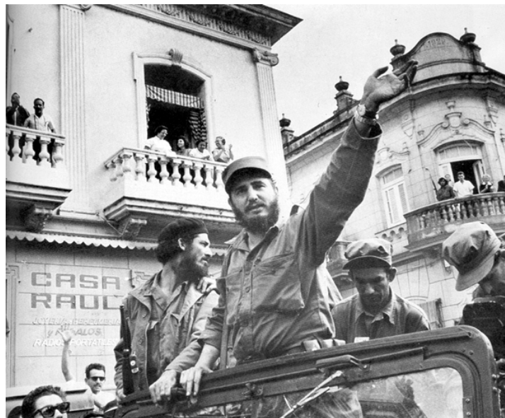
فیدل کاسترو و نیروهای انقلابی پیروزمند در هاوانا مورد استقبال قرار می گیرند، ۸ جنوری ۱۹۵۹

زنده باد انقلاب کوبا! برای پایان بخشیدن به محاصره به پا خیزیم!