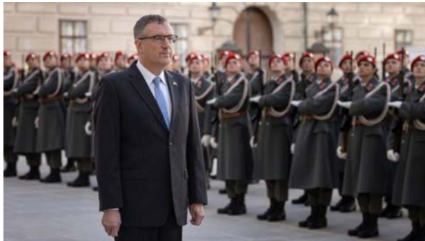
سفیر اسرائیل در اتریش

اتریش: ویدیوی مخفی از دیدار با سفیر اسرائیل، تحقیر انسانیت بازیگران دخیل را آشکار می‌کند.