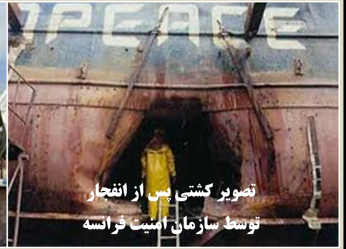
تصویر کشتی پس از انفجار توسط سازمان امنیت فرانسه