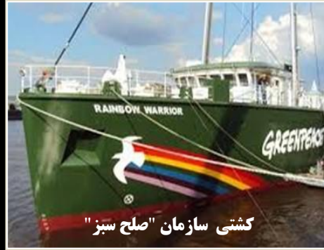
کشتی سازمان "صلح سبز"