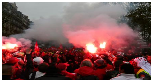
تظاهرات ۳۰ سپتامبر در پاریس

خلاصه‌ای از سرمقاله‌ی لافورش، ارگان مرکزی حزب کمونیست کارگران فرانسه، ماهنامه شماره ۵۳۳ اکتبر ۲۰۱۲