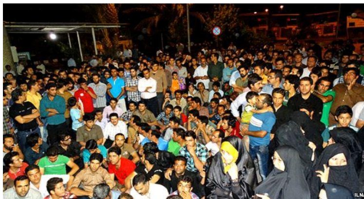
تجمع خانواده های کارگران و مردم شهر در مقابل فرمانداری

تحصن پنج هزار کارگر معدن سنگ آهن بافق که در تاریخ ۲۷ اردیبهشت امسال آغاز شد و به مدت ۳۹ روز طول کشید در پی موافقت هیات دولت با لغو موقت خصوصی سازی معدن در تاریخ ۴ تیر پایان یافت. مهلت دو ماهه کارگران به دولت که از پایان دوراوت اعتصاب آغاز شده بود، امروز سه شنبه پایان می یابد. اما کارگران با توجه به شناخت و آگاهی که از نیت سیاسی کارفرمایان و حامی آنها دولت سرمایه داری دارند به تحصن خویش ادامه داده تا به خواسته های طبیعی و انسانی خود دست یابند. لیکن دولت بجای پاسخ به مطالبات روشن کارگران بیشرمانه به بازداشت شماری از آنها مبادرت میورزد تا با ایجاد ترس و ارعاب و تهدید به اخراج و بگیر و ببندهای رایج فضا را بر کارگران تنگ کند و اعتصاب را در هم شکند.