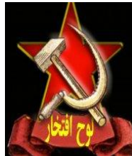
رفیق منوچهر تهرانی