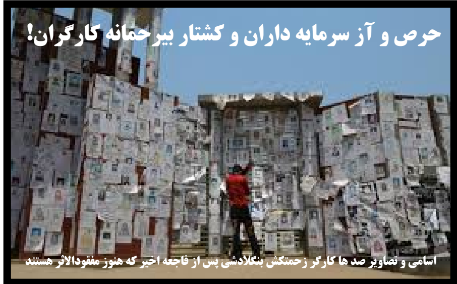
اسامی و تصاویر صدها کارگر زحمتکش بنگلادشی پس از فاجعه اخیر که هنوز مفقودالایر هستند

بر اساس قانون غیر رسمی و فوق العاده وحشیانه حاکم بر کارخانه های پوشاک در بنگلادش، اگر کارگری بدون اجازه کارفرما سر کار حاضر نشود؛ مجبور است در ازای هر یک روز غیبت ۲ روز مجاناً کار کند و با این که کلاً اخراج خواهد شد. با توجه به این وضعیت؛ کارگران مجبور شدند علیرغم خطری که احساس می کردند؛ وارد ساختمان پلازا شده و برای شروع کار به کارخانه ها بروند. یک ساعت بعد؛ ساختمان پلازا فرو ریخت و صدها تن از کارگران که بیشتر آنها کارگران زن بودند و برای تأمین زندگی خود و خانواده هایشان با ناچیزترین دستمزدها در کارخانه های مستقر در این ساختمان کار می کردند را زیر آوار دفن کرد.