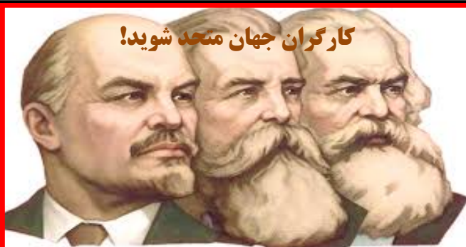
کارگران جهان متحد شوید!

... با شدت گیری تضاد عمیق کارگران و زحمتکشان و دیگر نوده های دربند ایران با رژیم حاکم و انعکاس این واقعیت در میان بالائی ها، حدت تضادهای فیمابین جناح های درونی رژیم به جانی رسیده است که آنها آشکارا به یکدیگر دندان نشان می دهند. شدت تضاد بین بالائی ها بحدی است که ولی فقیه به مثابه رأس دیکتاتوری حاکم حتی به بخشهایی از "خودی" های رژیم هم اجازه کاندیدا شدن در انتخابات را نمی دهد. بر اساس چنین واقعیتی دستگاه های تبلیغاتی از یک طرف می کوشند دعوای جناح های رژیم (بر سر منافع خویش و برای پیاده کردن طرح های خود جهت به انقیاد کشیدن هر چه بیشتر توده های تحت ستم ایران) را از نوع مبارزات انتخاباتی در غرب جلوه دهند و به این ترتیب قشرهایی از اتحاد جامعه را بهای صندوق های رای بکشانند و از طرف دیگر با استفاده از نفرت مردم از سردمداران رژیم به این فریبکاری متوسل می شوند که در صورت عدم شرکت مردم در انتخابات، فلان فرد منفعور قدرت را بدست خواهد گرفت و بهتر است آنها برای کوتاه کردن دست آن مهره "بدتر" حکومت، به مهره "بد" رای بدهند. ... صفحه ۲