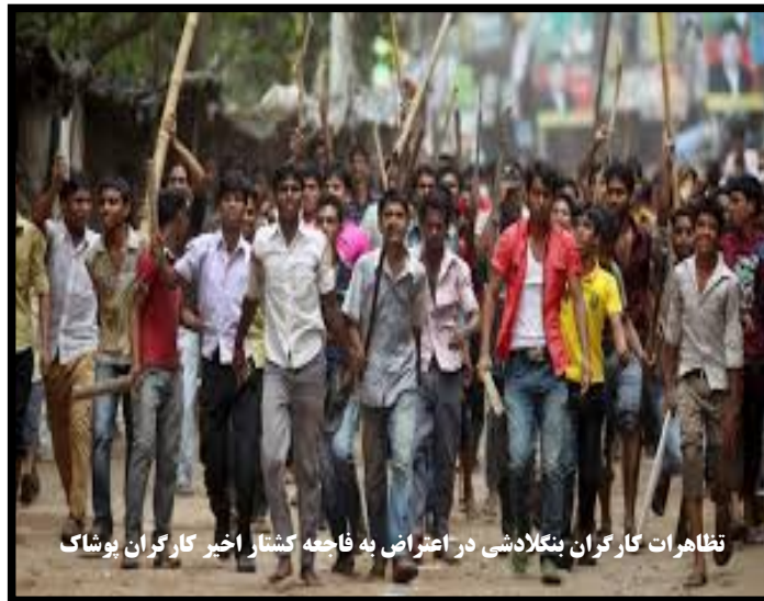
تظاهرات کارگران بنگلادشی در اعتراض به فاجعه کشتار اخیر کارگران پوشاک

(۶) برای مطالعه گزارش مزبور به لینک زیر مراجعه کنید http://www.thedailystar.net/bet-a2/news/factory-watch-just-farcical