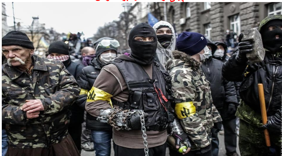
تصویری از تظاهرات نئو فاشیستهای اوکراینی که مورد حمایت مالی و معنوی اروپا و آمریکا قرار گرفته است

در بحثی که پیرامون مقاله تحلیلی حزب کار ایران (توفان) در مورد بحران اوکراین و آموزش از آن در فیسبوک حزب در گرفت، عده ای با همان با ابزار زنگ زده شبه ترنسکیستی به میدان آمده و با یک چرخش قلم و شعار علیه همه "امپریالیستها و همه دشمنان ریز و درشت مردم" به مسئله اوکراین پاسخ گفتند!! "نه به روسیه، نه به چین، نه به اروپا و نه به آمریکا...، زنده باد پیکار توده ها شعارشان هست. این عده که برخی از آنها از فرقه حزب مالیخولیای آوکیانیسم و برخی دیگر از فرقه حکمتیه تقوائیسم هستند به رغم گوناگونیهای ظاهری اما در بسیاری موارد از جمله نفی امپریالیسم و تضادهای درونی آن، سرنگونی رژیم اسلامی در پارکابی امپریالیسم، نفی جنبش فلسطین، لبنان و عراق و افغانستان و مخالفت با شعار خروج فوری و بی قید و شرط نیروهای امپریالیستی از خاک این کشورها... با یکدیگر هم نظرند و اختلافی بینشان نمی بینید.