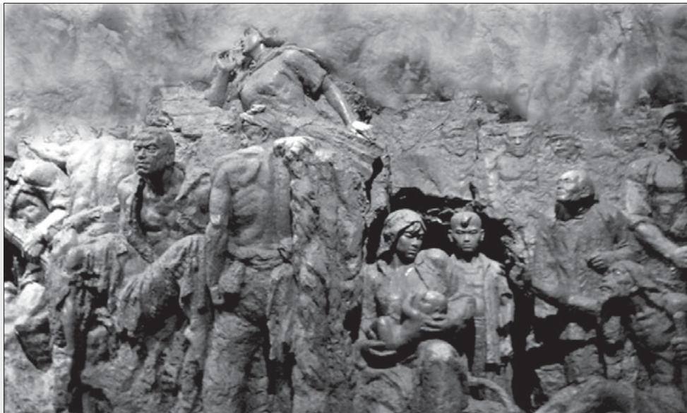
بخشی از سنگ نگاره‌ای که با الهام از رهایی جامعه چین از اعتیاد ساخته شده

نو اعلام کرد که مشکل مواد مخدر در شمال و شمال شرقی چین (که قبل از انقلاب مرکز جنگ خلق و پایگاه قدرت کمونیست‌ها بود و زودتر از سایر نقاط چین آزاد شده بود) اساساً ریشه کن شده. موفقیت کارزار در جنوب یک سال دیگر وقت لازم داشت.