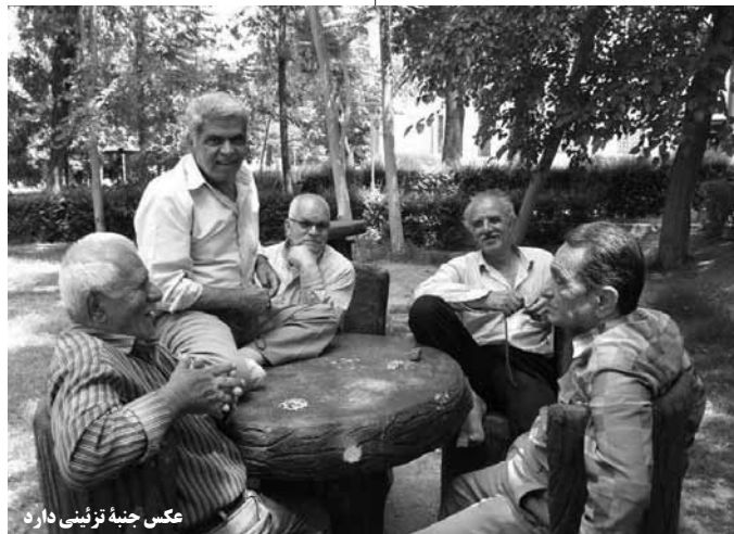
عکس جنبه تزیینی دارد

برنامه نویسی می‌کند. گروه‌هایی از دانشجویان در دانشگاه شریف هستند که به نوعی به آنان امکانات رفاهی می‌دهند تا بتوانند از بهره هوشی آن‌ها استفاده کنند! خودش می‌گوید از ما می‌خواهند برنامه‌های کامپیوتری را طوری بنویسیم که بتوان راحت به اطلاعات کسانی که از اینترنت استفاده می‌کنند دسترسی پیدا کرد.