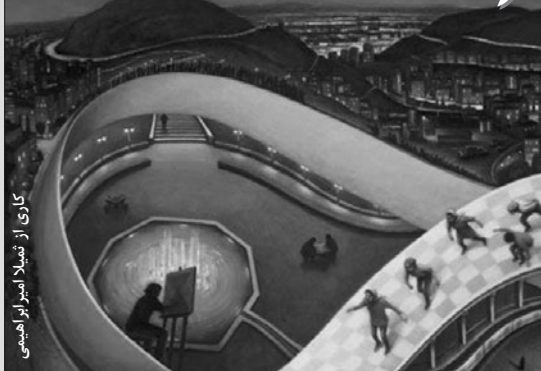
کاری از شملا امیرانزاهی