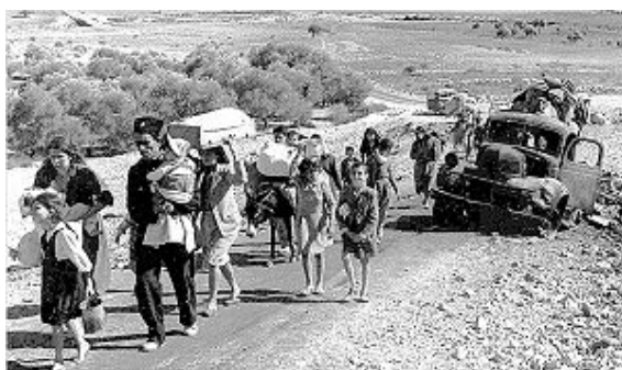
«یوم النکبه» روز مصیبت، روز تبعید فلسطینیان در سال ۱۹۴۸

«اسپیریت آف راشل کوری» بی آن که ردیابی شود وارد آب غزه شد. نیروی دریایی اسرائیل با تمام تجهیزات رادار و آخرین فن آوری هائی که در اختیار دارد، از ارسال و مأموریت این کشتی آگاه نشده بود. اسرائیلی ها آماده نبودند و از پیش هیچ اطلاعی درباره مأموریت راشل کوری نداشتند که از ماه ها پیش برنامه ریزی شده بود، و می بایستی به مناسبت روز «یوم النکبه» به ساحل غزه برسند.