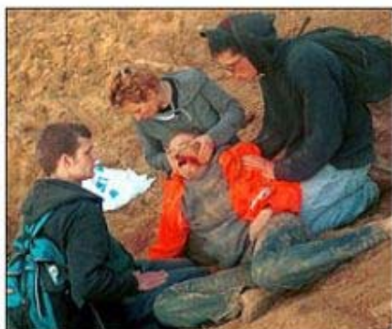
Rachel Corrie lies on the ground fatally injured by the Israeli bulldozer, Rafah, Occupied Gaza, 16 March 2003.