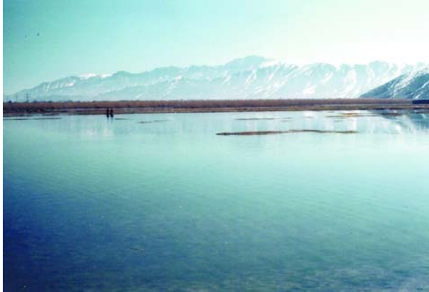
تصویر ۱ : کول حشمت خان در سالهای قبل از جنگ ضد روسی [۵]. تصویر ۲ : کول حشمت خان بعد از خشک کردن آن در سالهای بعد از جنگ [۵].