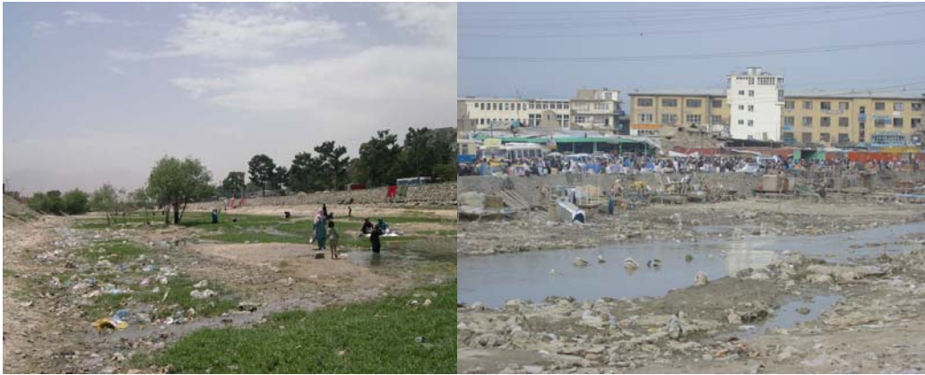
تصویر ۴ : دریای کابل در تابستانها [۲].

منابع آبهای کابل در اثر بی توجهی اولیای امور خسارات عظیمی را متحمل شده اند، زیرا از یک طرف زمین های زراعتی، باغستانها و چمنزار های کابل که حیثیت فلتر آب و هوا را داشتند از بین رفته اند، از جانب دیگر آبهای ایستاده مانند "کول حشمت خان" خشکانده شدند. دریای کابل که زمانی آب زلال داشت (بخش اول، تصویر ۱۲) و گاهی در مستی بود، سالهاست که از خروش مانده و به جوی کوچکی تبدیل شده که آب های گندیده شهر که آکنده از انواع مواد زهری و مکروبی است در آن به جریان می افتند و به آبهای زیر زمینی سرایت می کنند (تصاویر ۳ و ۴).