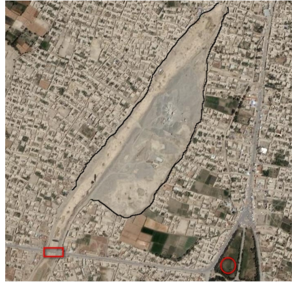
نقشه ۲ : منطقه ای که ریاست میخانیکوی از آن ریگ استخراج کرده و ساحه را تخریب نموده. دایره سرخ باغ قصر چهلستون و مستطیل پل محمد حسن خان بالای دریای کابل را نشان می دهد. نقشه از Google Earth ۲۰۰۸.

طبقات زمین در این منطقه از احجار مسامه دار که قابلیت خوب نفوذ آبر دارند و ساحات وسیع را احتوا می کنند، ساخته شده است. در نتیجه این ریگ کشی های نا بخردانه آبهای زیر زمینی این طبقات از دو طرف دریا به داخل دریا سرازیر گردیده و سطح آب زیر زمینی در دو طرفه دریا بیشتر از ۱۰ متر پایین افتیده است. این مسأله زمانی روشنتر می گردد که مسیر دریا بین منطقه پل محمد حسن خان و گذرگاه در چهاردهی ملاحظه گردد. از بهر مثال در منطقه پل محمد حسن خان در جریان سال منتهای طولانی دریا خشک می ماند، در حالیکه در منطقه گذرگاه دریای مذکور همیشه یک مقدار آب می داشته باشد. و این همان آبهای زیر زمینی است که از هر دو جانب دریا به عمیق ترین نقطه بستر دریا که همانا ساحه ریگ کشی ریاست میخانیکوی باشد، جمع گردیده جانب شهر به جریان می افتد. قرار مطالعات متخصصین روسی و آلمانی [۱، ص ۲۲] در ساحه جنوب غرب کابل، من جمله در همین منطقه، در ایام خشکی در هر ثانیه یک متر مکعب آب زیر زمینی به دریای کابل جریان می یابد.