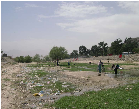
تصویر ۴ : دریای کابل در تابستانها [۲].

منابع آبهای کابل در اثر بی توجهی اولیای امور خسارات عظیمی را متحمل شده اند، زیرا از یک طرف زمین های زراعتی، باغستانها و چمنزار های کابل که حیثیت فلتر آب و هوا را داشتند از بین رفته اند، از جانب دیگر آبهای ایستاده مانند "کول حشمت خان" خشکانده شدند. دریای کابل که زمانی آب زلال داشت (بخش اول، تصویر ۱۲) و گاهی در مستی بود، سالهاست که از خروش مانده و به جوی کوچکی تبدیل شده که آب های گندیده شهر که آکنده از انواع مواد زهری و مکروبی است در آن به جریان می افتند و به آبهای زیر زمینی سرایت می کنند (تصاویر ۳ و ۴).