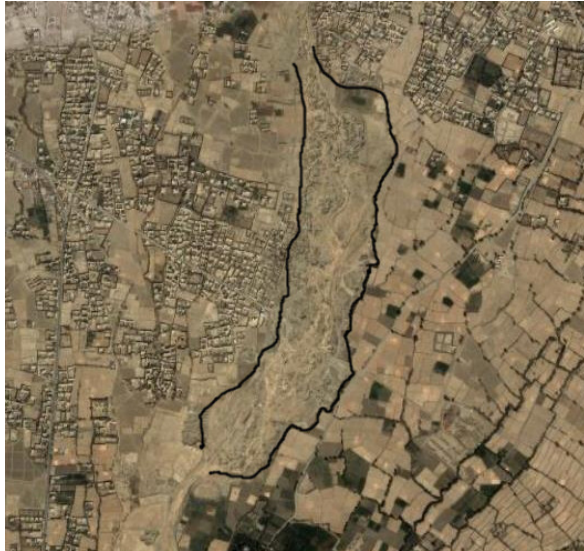
نقشه ۳ : ساحه ای به طول تقریبی ۳ کیلومتر و عرض ۰,۶ کیلو متر در منطقه چهلستون که ریگ آن کشیده شده و ساحه آن تخریب گردیده. نقشه از Google Earth ۲۰۰۸.

یکی از این خطاها را ریاست میخانیکوی قوای کار وزارت فواید عامه مرتکب شده که از ۶۰ سال به این طرف در منطقه بین قلعه غیبی و پل محمد حسن خان در چهاردهی کابل از داخل بستر دریای کابل ریگ می کشد. وزارت فواید عامه از این ساحه که به صورت تقریبی یک و نیم کیلومتر طول و نیم کیلو متر عرض دارد با و سایل بزرگ و مدرن تخنیک، مقادیر زیاد ریگ و جغله استخراج نموده و بستر دریا را ۳۰ تا ۴۰ متر عمیق گردانیده است (نقشه ۲).