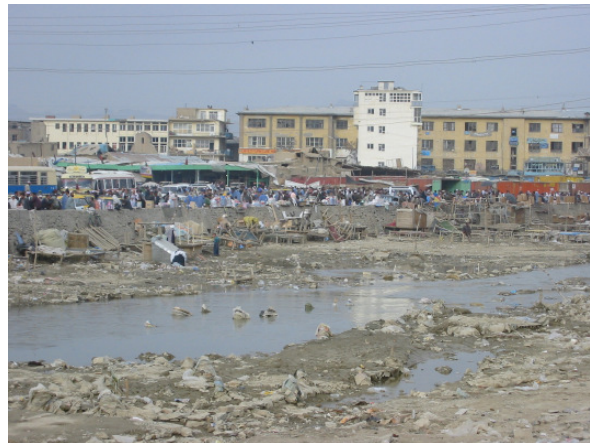
تصویر ۳ : دریای کابل بعد از آبخیزی [۲].

علاوه بر این تعداد عراده ها در کابل زیاد گردیده و سر به یک میلیون عراده می زند که در نتیجه مقدار گازهای مضر افزایش یافته است. این گازهای مضر که به هوا صعود می کنند دارای ترکیباتی از قبیل سرب، جست، کدمیوم، قلعی، نایتريت و غیره می باشند که با ریزش برف و باران دوباره به صورت محلول به زمین نزول کرده به آبهای روی زمینی و زیر زمینی سرایت می کنند. هیچ مرجعی بفرکر رهنمایی ترافیک نشده و سرک های فرعی آباد نکردند تا از هجوم موترها در شهر جلوگیری گردد. در نتیجه نفس کشیدن از یک هوای سالم میسر نیست و تا چند سال دیگر باشندگان کابل به امراض بیشتر شش مبتلا خواهند شد. مضاف بر این کثافات شهر من جمله روغنیات عراده جات و تجمع زباله ها در آبرو های شهر مصیبت دیگرست که منابع آبهای روی زمینی را تهدید می کنند.