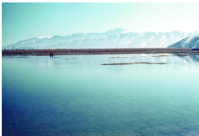
تصویر ۱: کول حشمت خان در سالهای قبل از جنگ ضد روسی [۵]. تصویر ۲: کول حشمت خان بعد از خشک کردن آن در سالهای بعد از جنگ [۵].