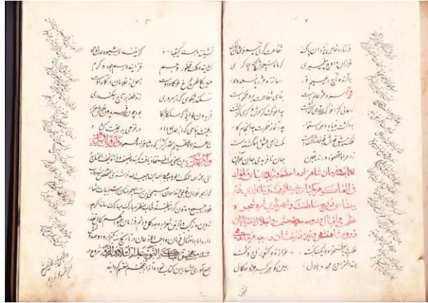
دیوان چاپ مرحوم "کاتب هزاره"