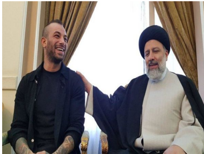
دست «شفابخش» رئیسی بر شانه تتلو

تتلو، در اینستاگرامش با انتشار عکسش در کنار حجت‌الاسلام رئیسی که در زمان انتخابات هم سر و صدای زیادی به پا کرده بود از سفر به مشهد مقدس خبر داد و کامنت‌های این پست خود را بست: می‌خوام برم مشهد واسه ویدئوی امام رضا دعا کنید یکم کارام سبک شه که بتونم برم، مطمئنم ویدئوی امام رضا به ویدئوی معمولی نخواهد بود.