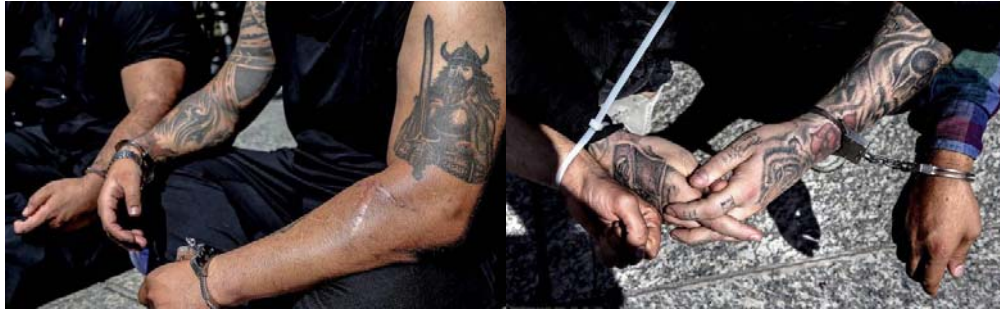
جوانانی که به دلیل خالکوبی و دستبند به دست، مانند برده به نمایش عموم گذاشته شده‌اند

اما همان‌طور که گفتیم در این مورد خالکوبی نیز برای «خودی»ها حکومتیان نه تنها جرم نیست، بلکه مایه «افتخار» شان هم هست. امیر تتلو، تمام بدنش را به غیر از پای چپش خالکوبی کرده است.