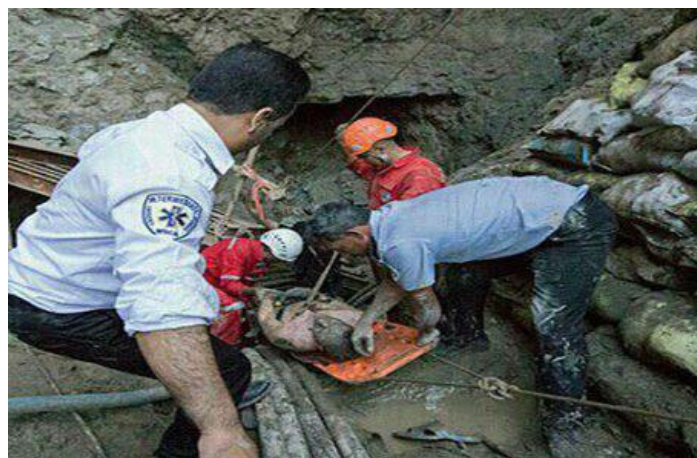
یکی از کارگران قربانی در انفجار کولغان - ۲۰ بهمن ۹۵

کارگاه‌ها و واحدهای مستقر در پلاسکو فاقد حداقل استانداردهای ایمنی بوده‌اند و بیش از دو هزار تن از کارگران شاغل در پلاسکو فاقد بیمه بوده‌اند. گفته شده است که طی ۱۵ سال اخیر بازرسی کار از کارگاه‌های فعال در این ساختمان صورت نگرفته بود.