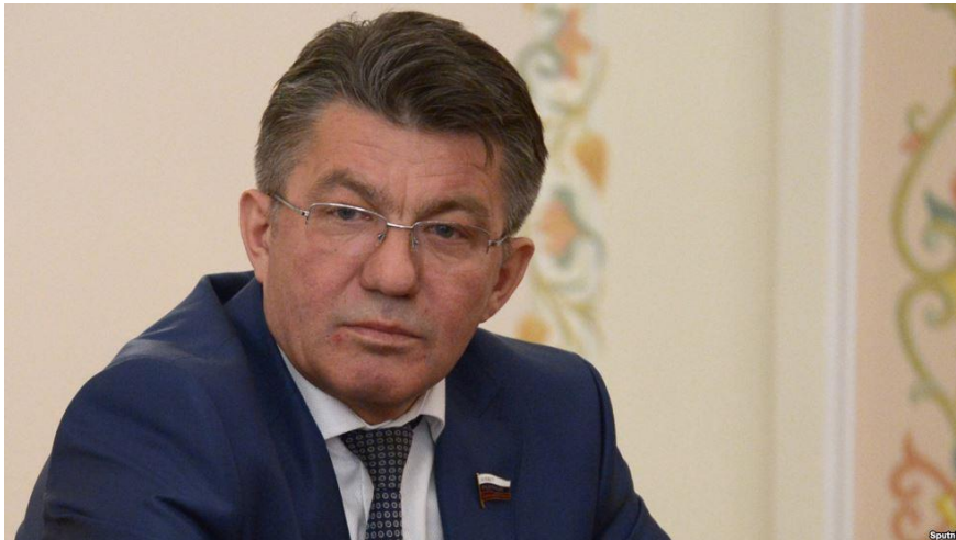
ویکتور اوزیروف، رییس کمیته دفاع و امنیت شورای فدراسیون روسیه