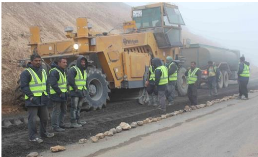
کارگران شرکت‌های پیمانکار وزارت راه و شهرسازی منتظر پرداخت دستمزد و عیدی خود هستند.

مشاور وزیر راه و شهرسازی جمهوری اسلامی ایران، گفت که این وزارتخانه بودجه ندارد که مطالبات پیمانکاران را بپردازد و به همین دلیل امکان پرداخت حقوق و عیدی کارگران این شرکت‌ها وجود ندارد.