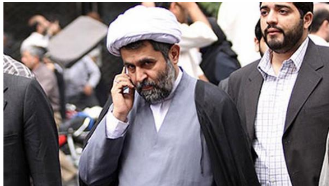
حسین طائب رییس سازمان اطلاعات سپاه پاسداران ایران

«آمنیوز» با استناد به منبع خود افزود که در این میان «محراب» با سپردن وثیقه بیرون از زندان به سر می‌برد اما «عظیم» و «افشاری» هنوز در زندان هستند. گفته شده که این بازداشت‌ها توسط سازمان حفاظت اطلاعات سپاه پاسداران صورت گرفته است. گزارش شده که یکی از مأموریت‌های اصلی «محمدحسین زیبایی نژاد» ملقب به «سردار نجات» در سازمان اطلاعات سپاه پاسداران، توقف فعالیت‌های اقتصادی این نهاد امنیتی بوده است. این در حالی است که از سپاه پاسداران ایران به عنوان بزرگ‌ترین موسسه اقتصاد موازی در این کشور نام برده می‌شود که پاسخگوی هیچکدام از قوای سه‌گانه این کشور نیست. در این گزارش آمده که «زیبایی نژاد» که پیش‌تر فرمانده سپاه حفاظت از ولی‌امر بود و پس از آن از معاونت فرهنگی سپاه پاسداران به سازمان اطلاعات سپاه کوچ کرد، معتقد است که فعالیت‌های اقتصادی سازمان اطلاعات سپاه پاسداران باعث رشد فزاینده‌ی بی‌قانونی، باج‌گیری، نا امنی اقتصادی و فساد مدیران و... در کشور شده و این فعالیت‌ها باید هر چه سریع‌تر متوقف شود.