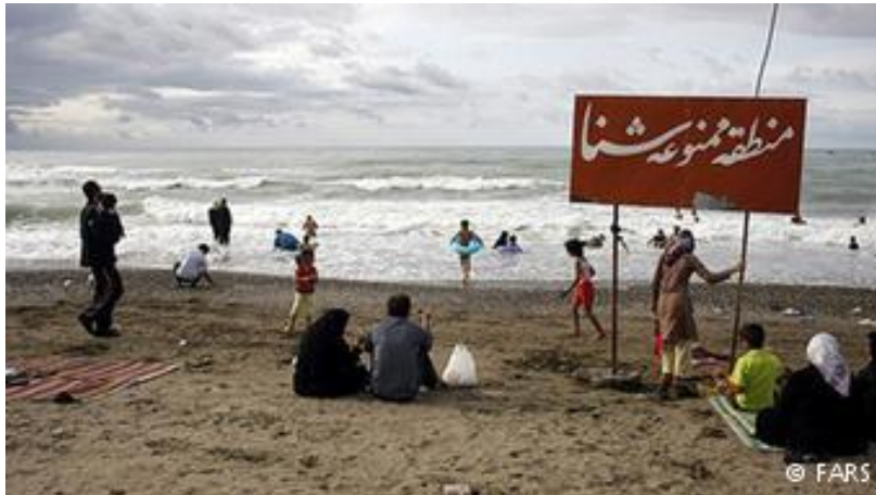
قسمتی از سواحل خزر هر سال به دلیل آلودگی منطقه ممنوعه اعلام می‌شود.

رئیس کمیته ایمنی و مدیریت بحران شورای شهر تهران درباره سامانه حمل و نقل عمومی هم یادآور شده که اتوبوس‌های دیزلی و تاکسی‌های تهران که از سوخت‌های یورو ۱ و یورو ۲ استفاده می‌کنند، سهم قابل توجهی در آلودگی‌های هوای تهران دارند. آباد معتقد است، سهم تاکسیرانی در انتشار آلودگی‌های شهر تهران بالا است و تاکسی‌های پایتخت روزانه ۲۵۰ کیلومتر مسافت را طی می‌کنند و در عین حال تعمیر و نگهداری درستی در زمینه آلودگی این خودروها صورت نمی‌گیرد.