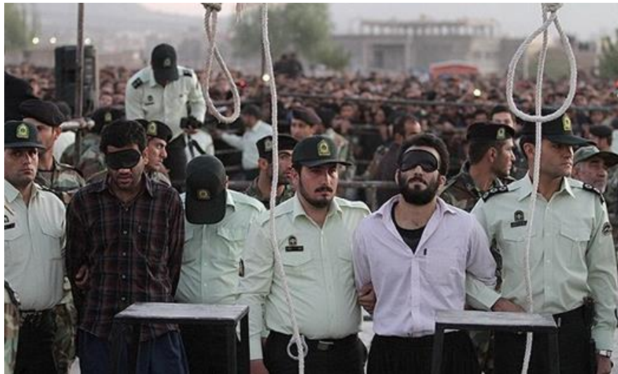
اعدام در ملاء عام در ایران