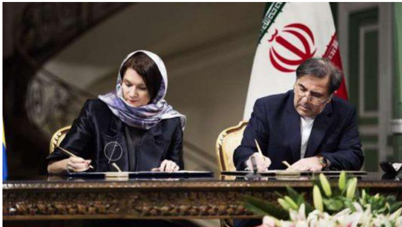
امضای قرارداد همکاری میان وزیر تجارت سوئد و طرف ایرانی

میلیارد و ۱۰۰ میلیون دلار) برای سوئد به همراه داشته و پس از تحریم‌ها به شدت پایین آمده بود، به نحوی که در سال ۲۰۱۴، به تنها ۳۳۰ میلیون دلار رسیده بود. روشن است که فضای ایجاد شده در ایران در نتیجه توافق هسته‌ای و برداشته شدن تحریم‌ها، فرصتی مناسب برای بازگشت سوئد به بازار پر سود و پر رونق ایران است.