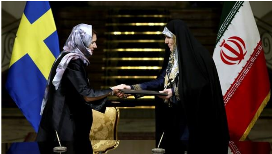
شاهیندخت مولاردی، معاون رییس جمهور در امور زنان و خانواده با آن لیندی، وزیر تجارت و امور اتحادیه اروپا

امضای قراردادهای تجاری اختصاص داشته است در خانه سفیر سوئد در تهران برگزار کردند و زنان سیاستمدار سوئدی در این دیدار بدون حجاب ظاهر شدند.