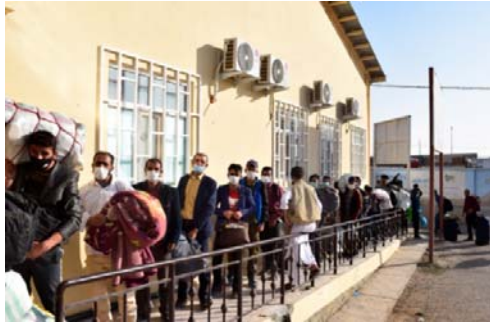
مهاجران اخراج شده افغان از ایران.

به این ترتیب، افغان‌ها از آسیب‌پذیرترین گروه‌های جامعه در ایران هستند و حکومت جمهوری اسلامی از آن‌ها به‌عنوان کارگران ارزان‌قیمت و قربانیان کم‌هزینه ماشین اعدام خود استفاده می‌کند. از این قربانیان با هدف ایجاد رعب و وحشت در جامعه انجام می‌شوند.