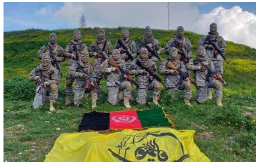
ایران از میان مهاجران افغان «لشکر بزرگ ۳۴ هزار نفری» را سازمان داد.

رضائی و صدها مهاجر افغان در ایران برای جنگ در سوریه به کار گرفته شدند. حالا ایران «به ناچار» یا خود خواسته نیروهایش را از این کشور خارج می‌کند و اعضای «لشکر فاطمیون» سرگردان میان بازگشت به افغانستان یا تحمل شرایط ایران مانده‌اند.