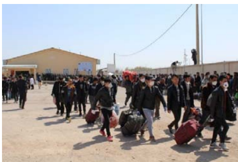
مهاجران اخراج شده از ایران.