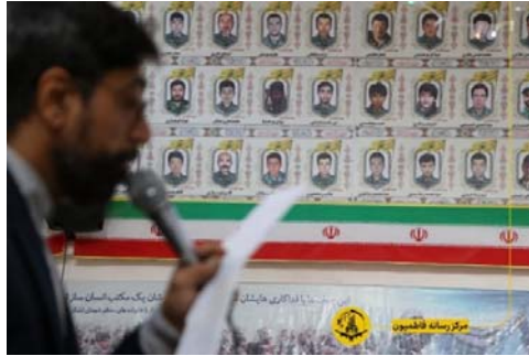
عکس‌های شماری کشته شدگان لشکر فاطمیون- کانال تلگرامی لشکر فاطمیون