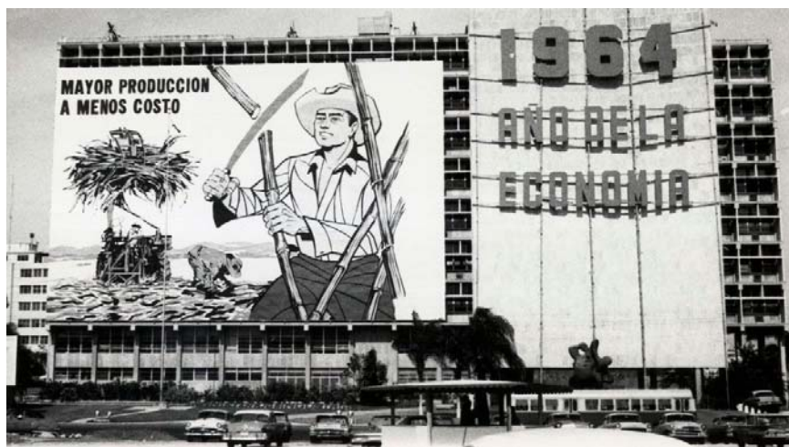
[تصویر: کوبا، ۱۹۶۴ | Gettyimages.ru.]

نیروهای سیا پیشنهاد دادند: «این آلودگی موفقیت‌آمیز کل محموله را خراب خواهد کرد که ارزش آن برای اتحاد جماهیر شوروی بین ۳۵۰,۰۰۰ تا ۴۰۰,۰۰۰ دالر تخمین زده می‌شود.» آنها نتیجه گرفتند: «کشتی درگیر، کشتی تجاری بریتانیائی استرتهام هیل بود. این عملیات با موفقیت، بدون هیچ مشکلی انجام شد و هیچ یک از پرسنل مرتبط با کشتی از این عملیات اطلاعی ندارند.»