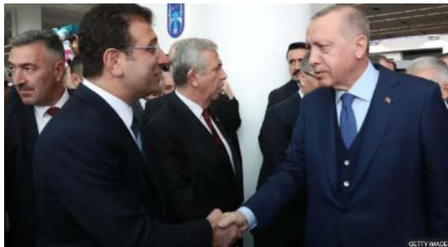
اردوغان و امام‌اوغلو

مقام‌های دادستانی ترکیه دستور بازداشت امام‌اوغلو و حدود ۱۰۰ نفر دیگر، از جمله شماری از خبرنگاران و بازرگانان را به اتهام فساد در مناقصه‌های شهرداری صادر کرده‌اند.