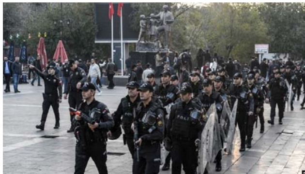
آماده‌باش پولیس استانبول در خیابان‌ها

عبدالله زیدان خطاب به خبرنگاران گفت: «همچنان که دیدید، دزدان بی‌شرم اراده مردم وان را لگدمال کردند. ما شهردار منتخب مردم هستیم و فقط مردم می‌توانند ما را عزل کنند. بدانید که این کودتاچیان شکست خواهند خورد و مردم پیروز خواهند شد.»