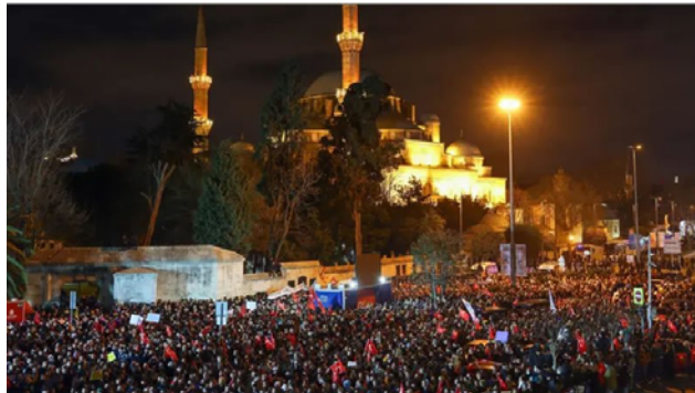
تجمع اعتراضی در حمایت از امام‌اوغلو در استانبول

انتخابات ریاست جمهوری بعدی در ترکیه در سال ۲۰۲۸ برگزار خواهد شد، اما اردوغان به دلیل محدودیت‌های قانونی، در دوره ریاست‌جمهوری بعدی نمی‌تواند برای دوره سوم نامزد شود مگر آن‌که انتخابات زودهنگام برگزار کند یا تغییراتی در قانون اساسی ایجاد شود.