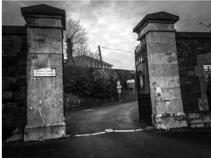
تصویر: رختشویخانه سنت وینسنت مگدالن کورک / مرکز سنت وینسنت کورک. | دامنه عمومی