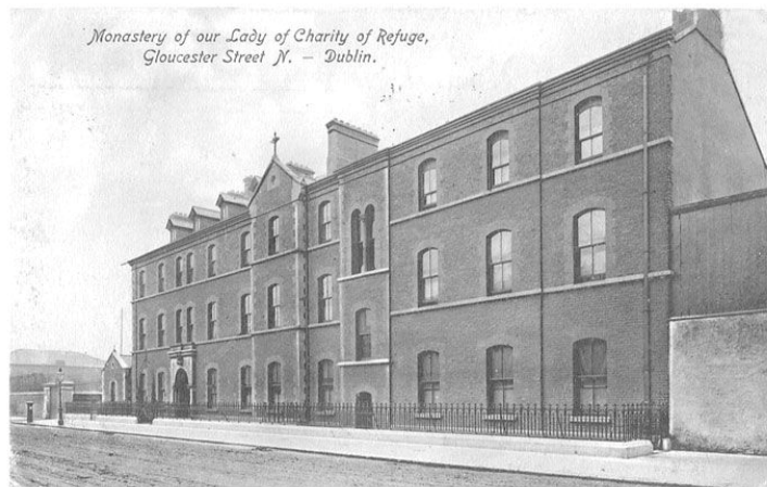
تصویر: صومعه بانوی ما از رحمت، دوبلین، ایرلند.

افرادی که به این مراکز فرستاده می‌شدند، دارای پروفایل‌های متنوعی بودند. در درجه اول، زنانی که بی‌بندوبار تلقی می‌شدند، مانند فاحشه‌ها یا مادران مجرد، به آنجا فرستاده می‌شدند.