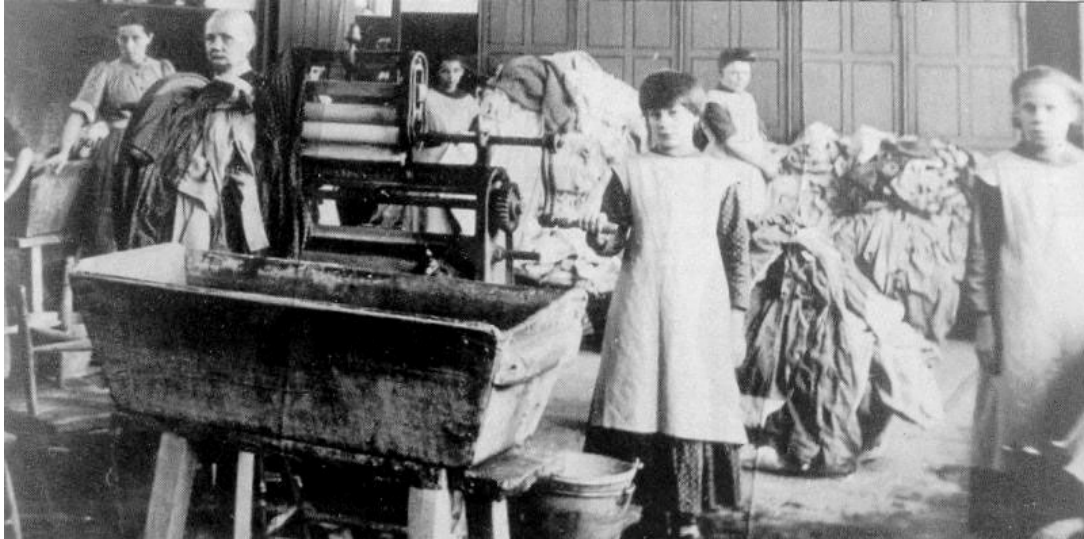
تصویر: زنان در یکی از رختشویخانه‌های مگدالن ایرلند در دهه ۱۹۴۰.

در پشت این دیوارها، هزاران دختر، نوجوان و زن زندانی و مجبور به انجام کارهای اجباری شدند، بدون این که هرگز دستمزدی دریافت کنند، در حالی که مورد آزار جسمی و روانی و گاهی اوقات تجاوز جنسی قرار می‌گرفتند. تحت مدیریت چهار فرقه مذهبی (خواهران رحمت، خواهران بانوی ما از رحمت، خواهران رحمت و خواهران شبان خوب)، رختشویخانه‌های مگدالن در ده نقطه از ایرلند قرار داشتند.